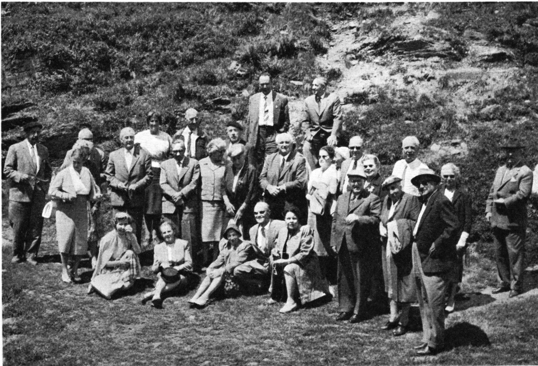
Die Reisegesellschaft auf dem Arlberg

und der reiche Beifall bewies ihm die Begeisterung der aufmerksamen Zuhörer.