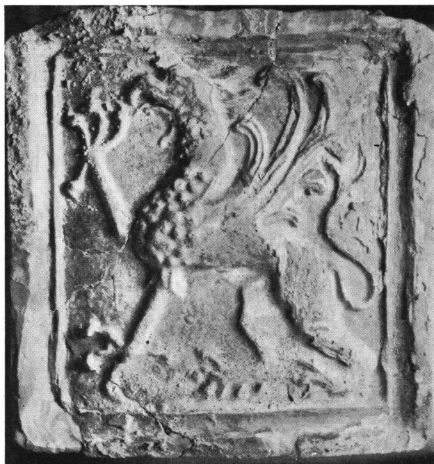
Sternenberg SO. Grün glasierte Blattkachel aus dem Wohnturm

Das ausgegrabene Mauerwerk ist konserviert worden und soll dem Publikum zugänglich gemacht werden. Über die Arbeiten ist eine eingehende Publikation in den «Jurablättern» in Vorbereitung. Werner Meyer