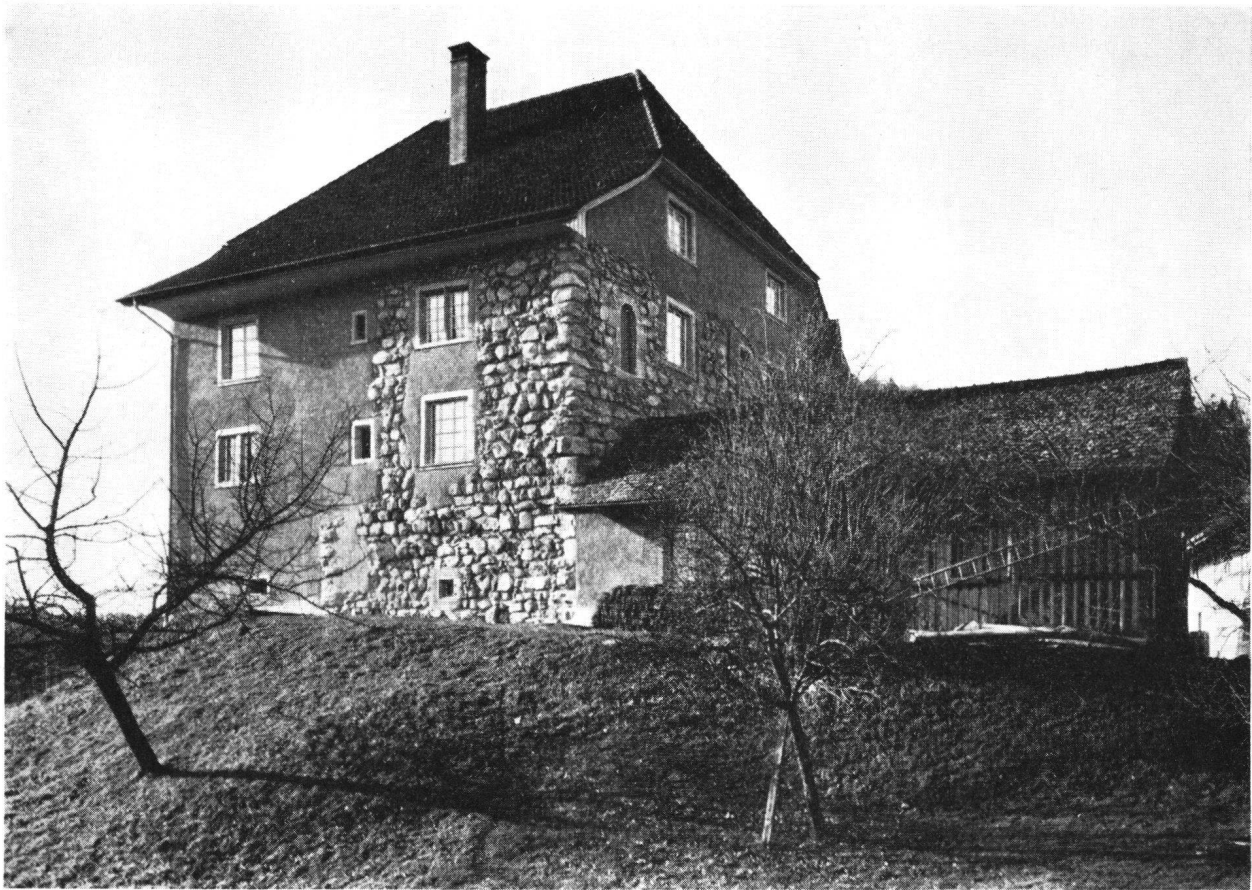
Pfarrhaus Schlatt bei Rätterschen