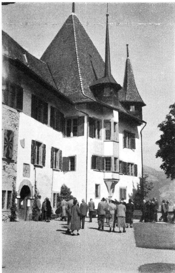
Im Garten vor dem Schloß Spiez.

An die Jahresversammlung schloß sich eine vom schönsten Wetter begünstigte 2½tägige Fahrt ins Berner Oberland zu den Schlössern Thun, Burgistein, Oberhofen und Ringgenberg am Brienersee. Die bisher nur sehr wenig bekannte Wasserburg Weißenau am Einfluß der Aare in den Thunersee (vgl. Nr. 2, Jahrg. 1954, S. 43) ist in den letzten Jahren von der allzu stark die Umgebung überwuchernden