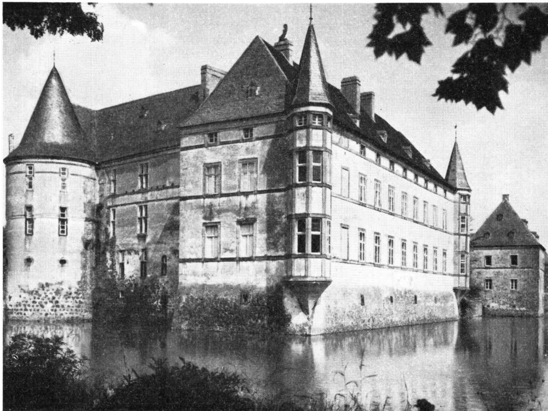
Schloß Adendorf, Kreis Bonn-Rheinbach

zum Getreidemahlen und zur Ölgewinnung. Daher liegt fast überall eine Wassermühle in nächster Nähe. Wenn geländemäßig möglich, wurden die Burgteiche öfters auch als Mühlenstauweiher ausgenutzt und sind zum Teil heute noch in Betrieb. Nur wenige Burggräben – wie in Odenhausen – werden durch stärkere Quellen gespeist. Diese Burg zeichnet sich durch fast völlige Originalerhaltung der Haupt- und Vorburg aus. Die Luftlinienentfernung von Odenhausen bis zur ehemaligen Residenz der kurkölnischen Lehnsgrafen im sog. Drachenfelder Ländchen auf Schloß Gudenau beträgt nur 3 Kilometer. Diese stolze und früher neben Krottorf imponierendste der rheinischen Wasserburgen besitzt 2 Vorburgen, von denen die ältere im 17. Jh. durch eine mächtige Torburg mit dem quadratischen, einen Binnenhof umschließenden «castel» des Herrenhauses zusammengeschweißt und ausgebaut wurde.