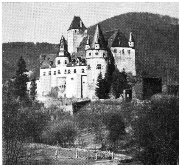
Schloß Bürresheim in der Eifel

Weiter wären noch zu nennen die Schlösser Bergerhausen und Lörsfeld , die vielleicht nur im Vorbeifahren besichtigt werden können. Das