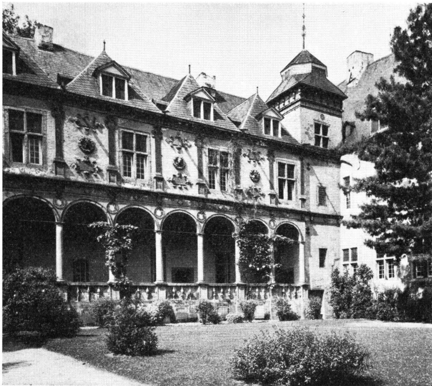
Schloß Rheydt bei der gleichnamigen Stadt