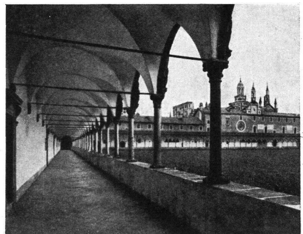
Certosa von Pavia

In den entsprechenden Kosten sind enthalten: Alle Veranstaltungen, Autofahrten ab Zürich und nach Zürich zurück, Unterkunft und Verpflegung in Hotels und Restaurants (ohne Getränke bei den Mahlzeiten), Bedie-