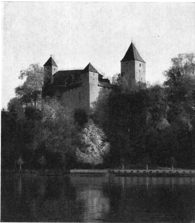
Die Burg von Norden. Aufnahme von 1948

Wir richten nun die freundliche Bitte auch an unsere Mitglieder, mitzuhelfen, das Schloß Rapperswil in sachgemäßer Weise zu restaurieren.