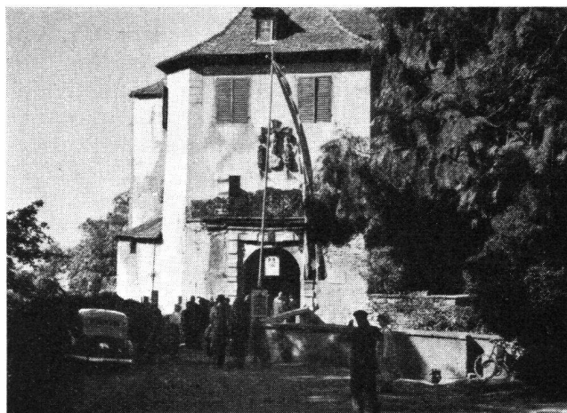
Besuch in der alten Burg zu Meersburg

Gänzlich anders, wenn auch nicht weniger interessant war der am folgenden Morgen unternommene Besuch im Städtchen Meersburg . Sein Name hat mit dem „Schwäbischen Meer“ — eine Kombination, die zwar nahe liegt — kaum etwas oder höchstens in romantischer Verklärung zu tun. Er leitet sich vermutlich von dem schon früh gebräuchlichen Eigennamen „ Merti “ = Martin ab. Schon dies deutet auf hohes Alter, und wirklich möchte man im „ Alten Schloß “ eine der ältesten, wenn nicht die älteste, aus merowingischer Zeit stammende Burg Deutschlands erkennen. Der feste, im untern Teile aus rohen Findlingsblöcken errichtete Bergfried, der sog. „ Dagobertsturm “, ist jedenfalls frühmittelalterlich. Zur kräftigen Bauweise, auch der vor allem im 14. und im 16. Jahrhundert entstandenen Außenwerke, gesellt sich die beherrschende Lage der Burg auf einem vom Hinterland und der Stadt künstlich abgetrennten Bergsporn hoch über dem Seeufer, zu dem ein aus dem Molassefelsen gehauener, unterirdischer Gang