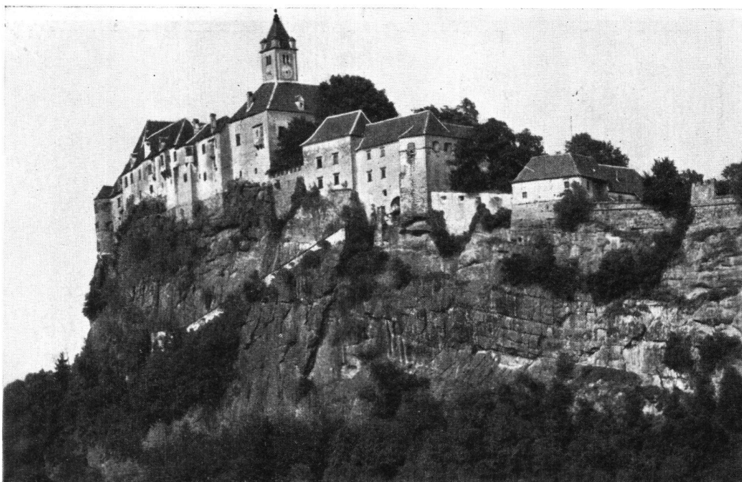
Die imposante Riegersburg in der Steiermark