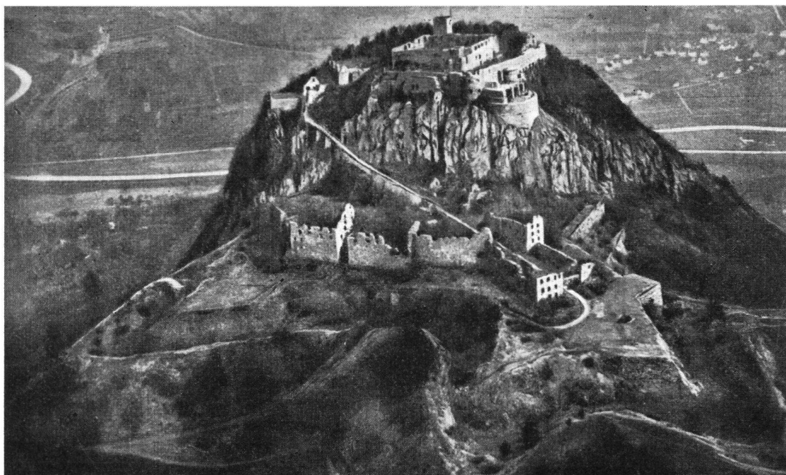
Der Hohentwiel, der besucht wird, vom Flugzeug aus gesehen

Vom Bodanrück blickt man nach Westen über die Hegausenke hinweg auf die Doppelreihe von Vulkangipfeln, die in alter Zeit alle Burgen trugen, von denen uns heute noch Ruinen künden. Rechts in der Tiefe, versteckt liegt Schloß Langenstein, gegründet auf dem Felsen des „langen Steins“. Von Norden, von den Höhen des Donautals nach Süden schweift unser Blick über den Hohenhöwen, den Mägdeberg, den Hohenkrähen mit seinen markanten Mauertrümmern, den Hohenstoffeln, der einst drei Burgen trug, zu Deutschlands größter Burg- und Festungsrue, dem Hohentwiel. Südlich davon ragt nahe der Schweizer Grenze, an der Ecke des Randengebirgs, die alte, aber heute noch bewohnte