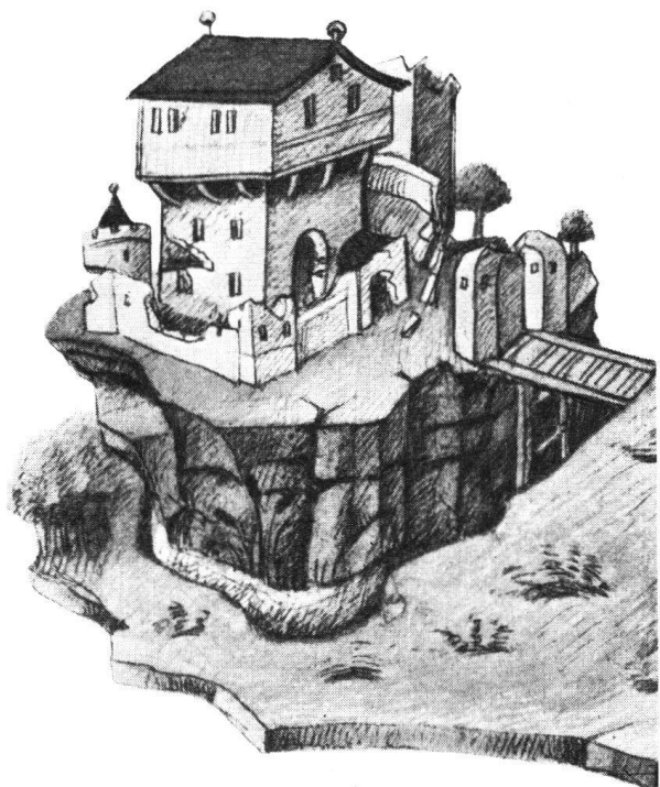
Fig. a. Einnahme der Burg Halten bei Kriegsstetten, Solothurn (aus der Berner Bilderchronik des Benedikt Tschachtlan von 1470).

bilder sind in großer Mannigfaltigkeit dargestellt, wir lernen ziemlich genau kennen, wie mittelalterliche Wehrbauten des 15. und 16. Jahrhunderts ausgesehen haben. Aber in den allerwenigsten Fällen sind es naturgetreue Wiedergaben, sondern Phantasiegebilde, die zeigen, wie damals der Mensch sich eine Burg vorstellte. Die Zeichnungs- und Malkunst (Buchmalerei) des Mittelalters hatte damals bei uns noch nicht jene künstlerische Höhe erreicht, wie sie in Frankreich und Italien und den Niederlanden ausgeübt wurde und wovon schöne und gut erhaltene Beispiele vorhanden sind. Immerhin haben sich die Künstler unserer Bilderchroniken bestrebt, die Stadt- und Landarchitekturen ihres nächsten Wirkungskreises möglichst naturgetreu wiederzugeben.