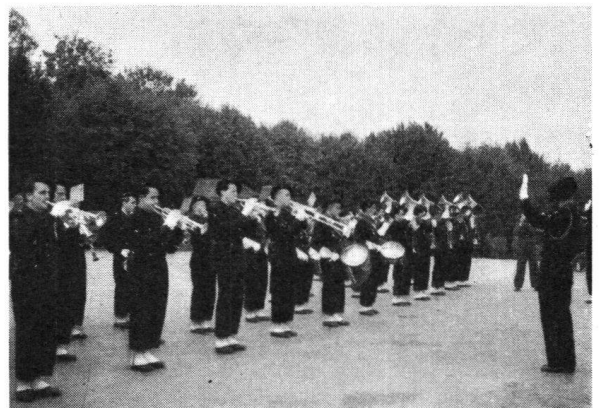
Empfang durch die „clairons et tambours“ in Altkirch.