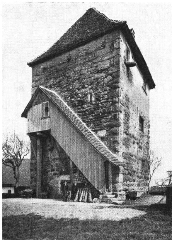
Fig. c. Der Burgturm von Halten , wie er heute aussieht.

In den beiden Chroniken von Edlibach aus den Jahren 1490 und 1500 sind zwei Ansichten