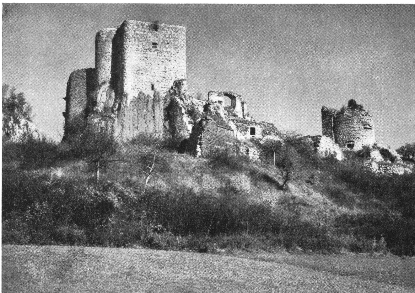
Landskron unweit Basel.