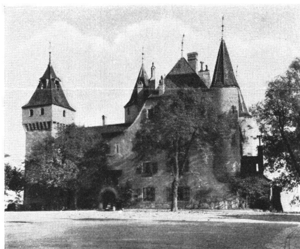
Schloß Nyon nach der Beseitigung des unschönen Häuserblockes

(In Meran haben es die Italiener umgekehrt gemacht. Dort wurde die noch vor 15 Jahren in einer reizenden idyllischen Umgebung befindliche, in ihrem Bau noch