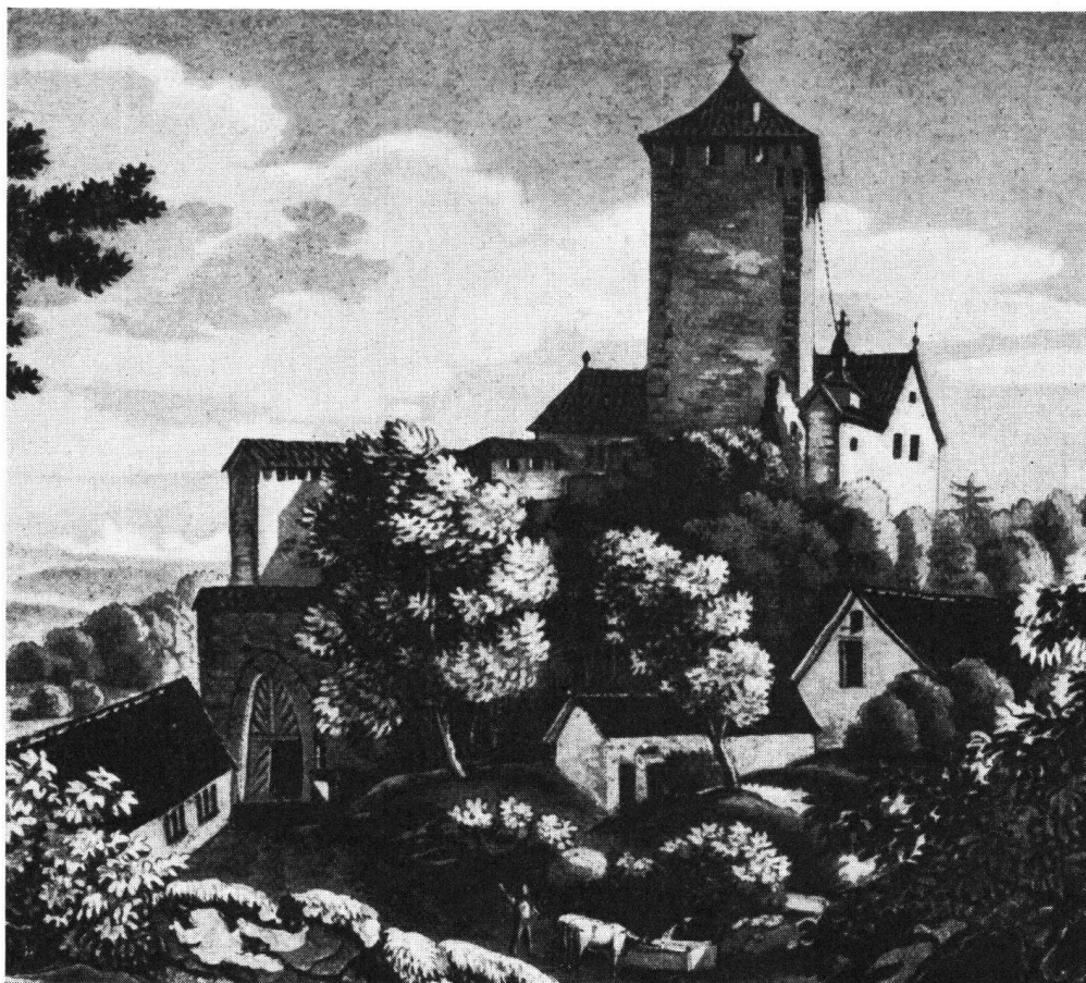
Ansicht des Schlosses Herblingen nach Joh. Beck (Anfang 19. Jahrhundert)

man heizbar machen kann, drittes Etage : sechs neu tapezierte Zimmer, wovon vier mit neuen Kachelöfen versehen, eine Küche mit neuem eisernen Kunstherd, Decke und Rohr, Dörr- und Bratofen, alles massiv, große Steinplattenlauben, wie auf jedem Stock und neue Fenster, ein Türmchen mit großer Glockenuhr auf der Galerie, zwei Estriche sammt Aufzug, ein gewölbter Keller mit zirka 155 Saum in Eisen gebundenen Fässern. Im Hof ein Thurm von 14 Schuh dicken Mauern, sehr tauglich für Wahnsinnige zu beherbergen (!), ein Waschhaus , ein laufender Brunnen, außer dem Thore eine neue Scheune für etwa 20 Stück Vieh, großer Garten mit zwei Treibhäusern, bequem für Bäder einrichten, ein Hühnerhof, Wieswachs für vier Kühe, am Schloßberg 9 Vierling Reben von bestem Gewächs, am Fuße 5 Juchart Ackerland mit Korn ausgesaet und etwas Holz daneben. Das Wesen (!) würde sich vorzüglich für einen Arzt eignen, der eine Heil- oder Kuranstalt zu errichten wünschte, die Lage ist schön, die Luft ist rein.