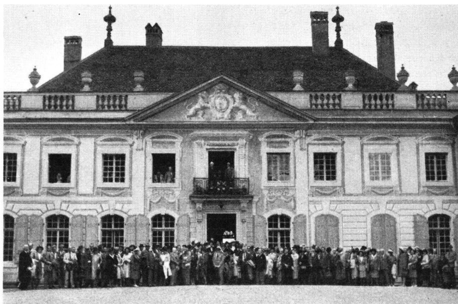
Vor dem Château d'Hauteville

Höhepunkt der Fahrt bedeutet Champvent bei Yverdon. Im mächtigen, eigens für uns geschmückten Rittersaal wird das Mittagessen eingenommen. Für alle zweihundert Gäste ist Platz. Draußen ist es schwül; hier aber, hinter den drei Meter dicken Mauern, läßt sich in angenehmer Frische herrlich pokulieren. Was soll man mehr bewundern, die einfache, nach savoyischem Vorbild gegliederte, jeder Zierde und Verunstaltung bare,