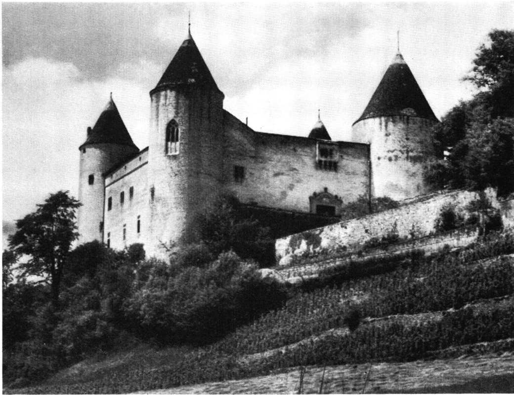
Champvent , das starke Schloß der einstigen Herren von Grandson, in dessen großem Rittersaal ein Mittagessen serviert wird