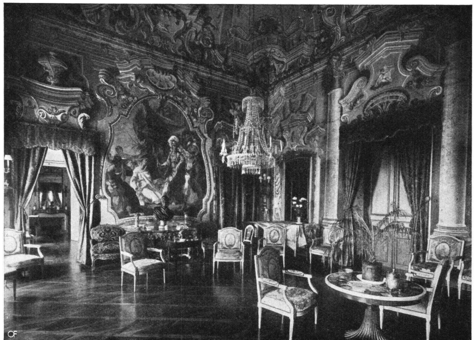
Château d'Hauteville Le grand salon

Mit der Anmeldung sind für die Zwischen- verpflegung 2 Mahlzeiten- coupons einzusenden.