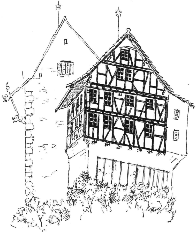
Wie der Giebel der Burg in Zug aussehen würde, wenn man ihn vom Verputz befreite. (Siehe Bild oben Seite 244)

ausführliche Beschreibung der Ausstattung der einzelnen Räume der Burg zu geben. Indessen soll noch kurz der Besitzverhältnisse Erwähnung getan werden. Die Burg zu Zug gehörte in vielfachem Wechsel alten Zugerfamilien. 1600 sind es die Letter, 1625 die Brandenburg, 1658 die Wikart. Von 1703 bis 1762 gehörte die Burg den Landtwing, der letzte Besitzer aus dieser Familie war auch Eigentümer der Burg St. Andreas in Cham und ist bekannt als Stifter des Landtwing'schen Fideikommisses. Im letztgenannten Jahre gelangte die Burg an den Pannerherrn Leodegar Kolin und nach dessen 1792 erfolgten Tode an die Familie Roos. Von einem Angehörigen dieser Familie stammt das beigefügte Bild mit Ansicht der Burg von der Südseite. In den letzten Jahrzehnten gehörte die Burg der Familie Hediger, die viele bauliche Änderungen vornahm. Es wird nun bei den Zugern liegen, das altehrwürdige und interessante Bauwerk einem würdigen Bestimmungszwecke zuzuführen und eine sorgfältige Restaurierung anzuordnen. Dann kann die alte Burg zu Zug zu einem währschaften Schmuckstück der Stadt und zu einer neuen