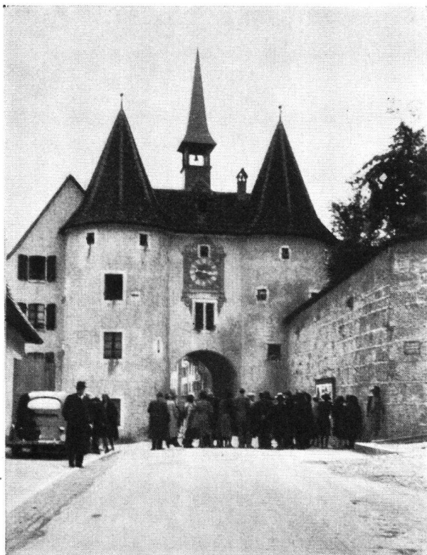
Vor der Porte de France in Pruntrut

kleine Schweizerstadt sie beneiden könnte. Und so wie das Städtchen freundlich zwischen die waldreichen Hänge am Ufer des Doubs gebettet ist, so liebenswürdig sind seine Bewohner. Sie bereiten uns denn auch am Ursicinusbrunnen vor dem spätromanischen Südportal der Stiftskirche einen herzlichen Empfang. Der Maire selbst erzählt von der Geschichte des Städtchens, und Abbé Chapatte übernimmt die Führung durch die Kollegialkirche. „Les pierres qui parlent...“, er läßt die Steine sprechen, und seine Begeisterung ist so echt, daß etwas von seiner eindringlichen Eloquenz mitschwingt, mit der er wohl seine Predigten erfüllt. Zum Abschied grüßen wir noch den Heiligen Nepomuk auf der Doubsbrücke und versprechen, bald wieder zu kommen. Vielleicht hat bis dann der neu gegründete Verkehrsverein die Reste der alten Burg, die einst das Städtchen beherrschte, in seine Obhut genommen.