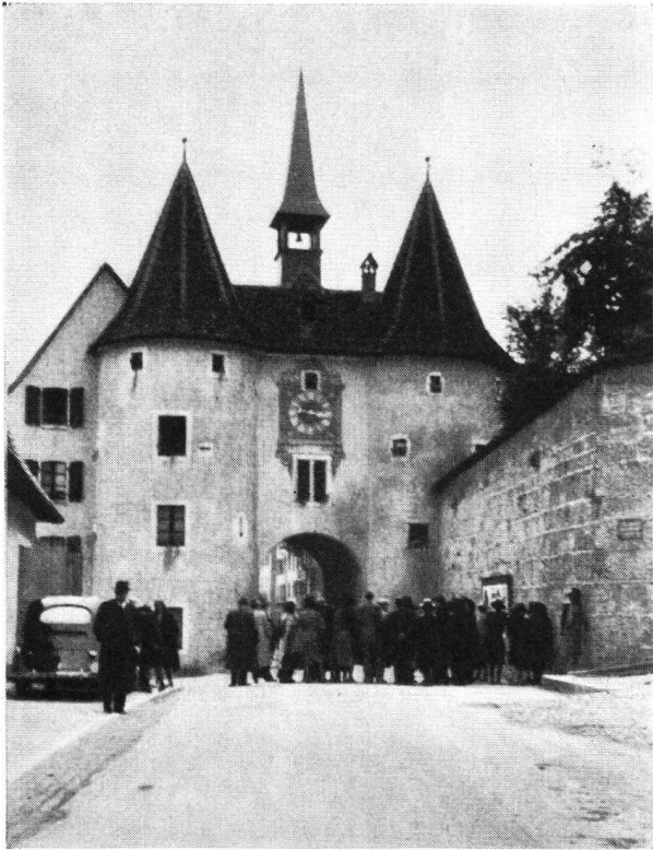
Vor der Porte de France in Pruntrut