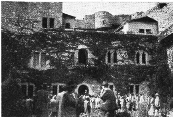
Im Hof des Schloßberg ob Neuenstadt

Der Samstag gilt dem Bielersee. In La Neuveville steigen wir zum Schloßberg hinauf. In eigenartiger Weise sind hier Ruine und behaglicher Wohnbau vereinigt. Mag auch das Ganze nicht den Vorstellungen richtiger Denkmalpflege entsprechen, so übersieht man das Störende gern, weil dafür eine unvergleichliche Aussicht entschädigt, die vom Bielersee über den Ziehlkanal bis zum Neuenburgersee und in die Berneralpen reicht, und die es verstehen läßt, warum die Basler Bischöfe am äußersten Südwestzipfel ihres Bistums eine strategisch wichtige Burg erbauen ließen. Von kundiger Seite werden wir über die Geschichte