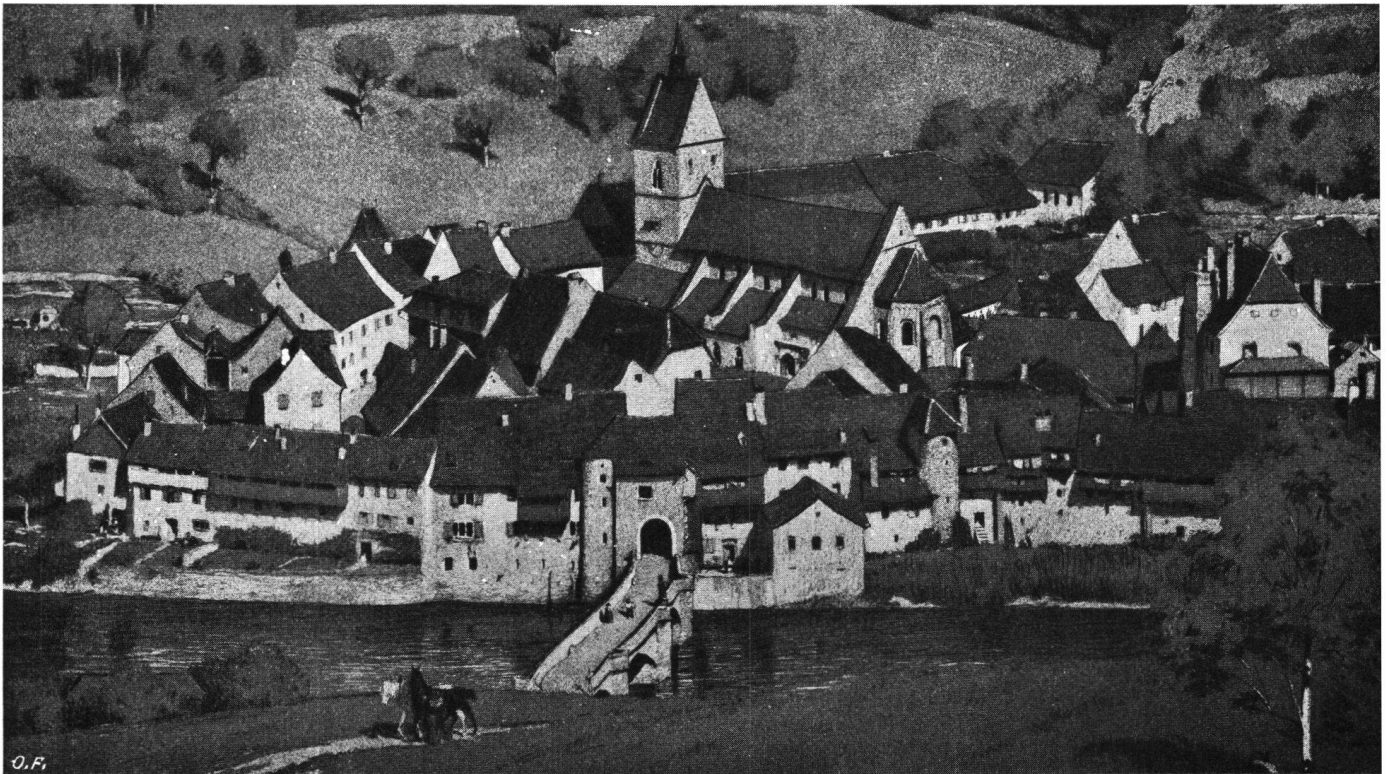
Aus dem „Bürgerh

Das malerische Städtchen St. Ursanne mit seiner berühmten „Collegiale“ und dem Kreuzgang, nach einem farbigen Steindruck von Emil Schill 1905