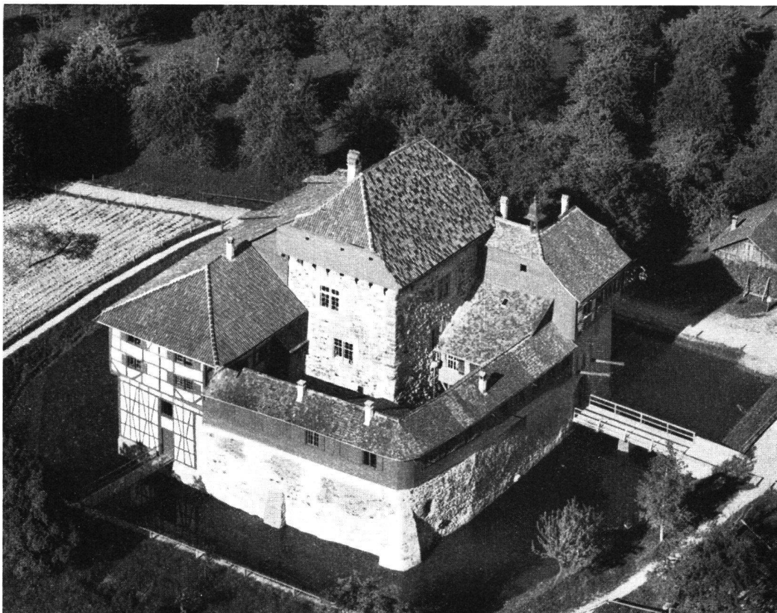
Die Wasserburg Hagenwil bei Amriswil, welche besucht wird