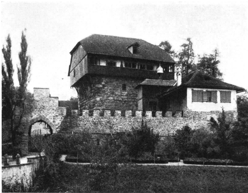
Burg Mammertshofen bei Roggwil