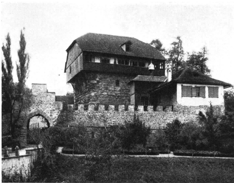
Burg Mammertshofen bei Roggwil