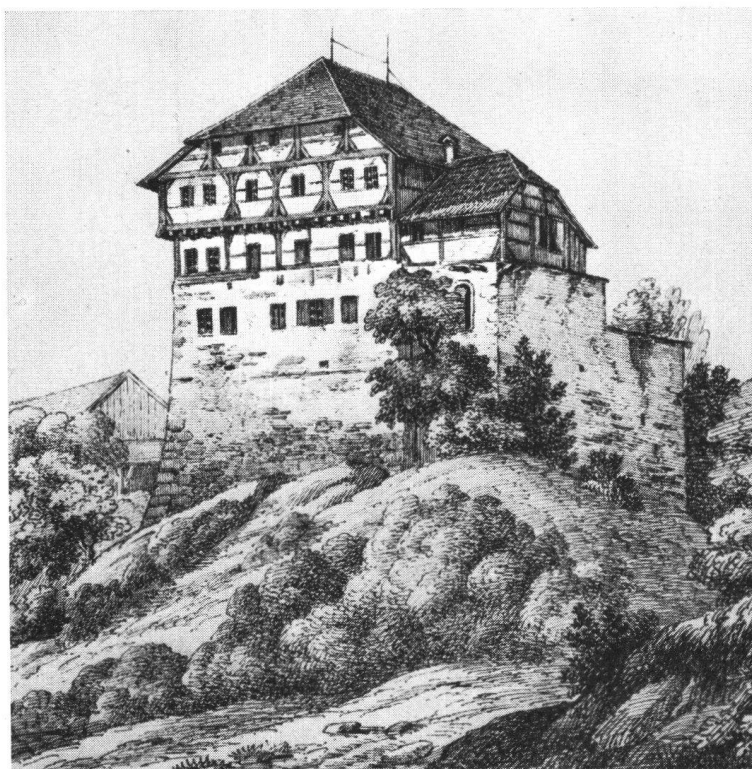
Zuckenriet nach einer Federzeichnung von J. J. Rietmann 1848

Wer im Postauto von der st. galischen Bundesbahnstation Wil nach Bischofszell sich begibt, erlebt in einer starken Stunde eine Burgenfahrt im kleinen: Er umfährt die Süd- und Ostflanke der Altstadt Wil, auf deren höchstem Punkte der Fürstabt Ulrich VIII. von St. Gallen auf der Stelle des ehemaligen gräflich toggenburgischen Schlosses das mächtige Hofgebäude errichten ließ; er erblickt nach viertelstündiger Fahrt über der Kirche von Zuzwil, die auf ihrem hohen Standort mit der Friedhofmauer wie eine befestigte Kirche sich ausnimmt, hoch oben am Berg- hang einen merkwürdigen Gelände- einschnitt: den Graben der einstigen Burg der „Löwen von Zuzwil“, um sich nach weiteren 20 Minuten Fahrt vom Anblick des noch so wohl erhaltenen Schlosses der „Löwen von Zuckenriet“ überraschen zu lassen und nach einer letzten halben Stunde des Schlosses weiland des Fürst- bischofes von Konstanz in seiner Stadt Bischofszell ansichtig zu werden, von der aus dieser so manchmal den Fürst- abt von St. Gallen bedroht hat.