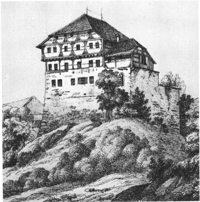
Zuckenriet nach einer Federzeichnung von J. J. Rietmann 1848

Wer im Postauto von der st. galischen Bundesbahnstation Wil nach Bischofszell sich begibt, erlebt in einer starken Stunde eine Burgenfahrt im kleinen: Er umfährt die Süd- und Ostflanke der Altstadt Wil , auf deren höchstem Punkte der Fürstabt Ulrich VIII. von St. Gallen auf der Stelle des ehemaligen gräflich toggenburgischen Schlosses das mächtige Hofgebäude errichten ließ; er erblickt nach viertelstündiger Fahrt über der Kirche von Zuzwil , die auf ihrem hohen Standort mit der Friedhofmauer wie eine befestigte Kirche sich ausnimmt, hoch oben am Berghang einen merkwürdigen Gelände-einschnitt: den Graben der einstigen Burg der „Löwen von Zuzwil“, um sich nach weiteren 20 Minuten Fahrt vom Anblick des noch so wohl erhaltenen Schlosses der „Löwen von Zuckenriet“ überraschen zu lassen und nach einer letzten halben Stunde des Schlosses weiland des Fürstbischofes von Konstanz in seiner Stadt Bischofszell ansichtig zu werden, von der aus dieser so manchmal den Fürstabt von St. Gallen bedroht hat.