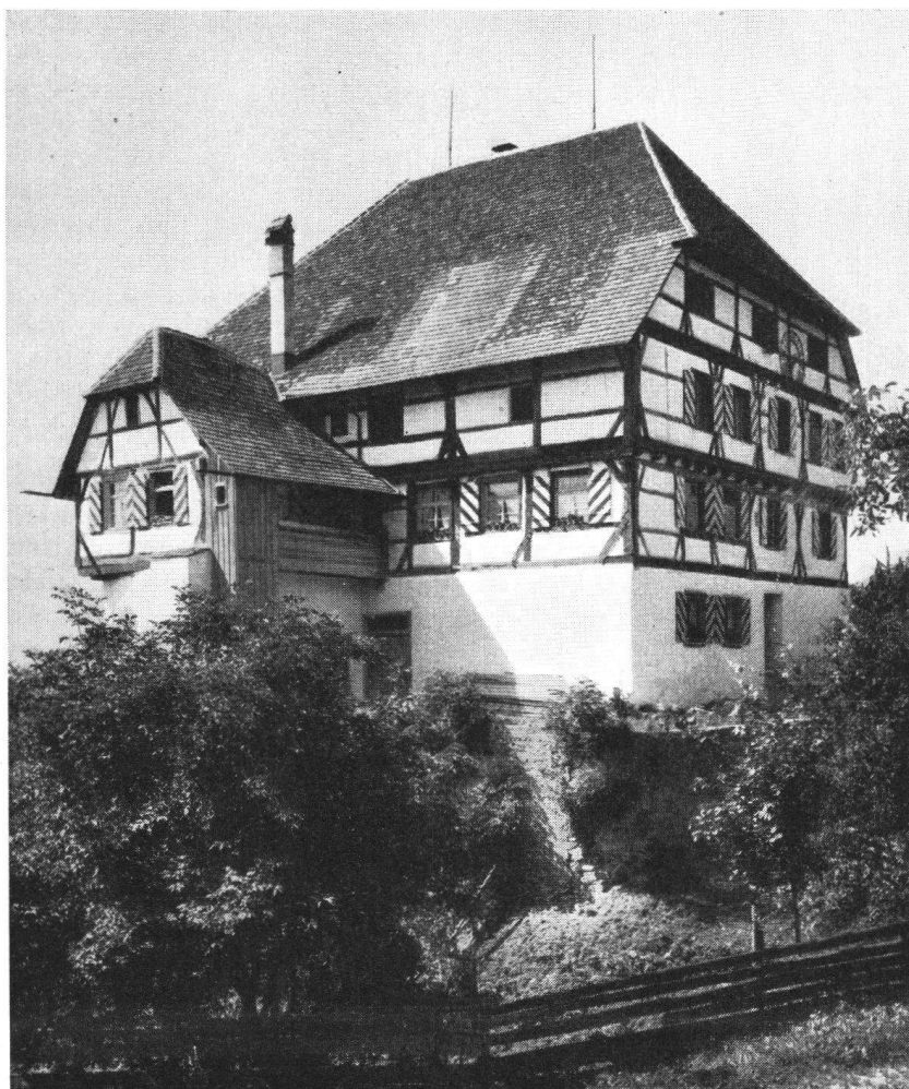
Die Burg nach der Restaurierung von Norden gesehen. Links der Anbau mit der Kapelle.