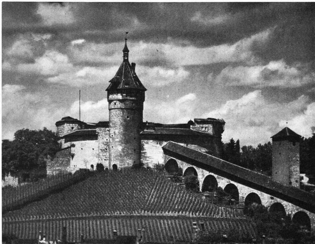
Der Munoth ob Schaffhausen