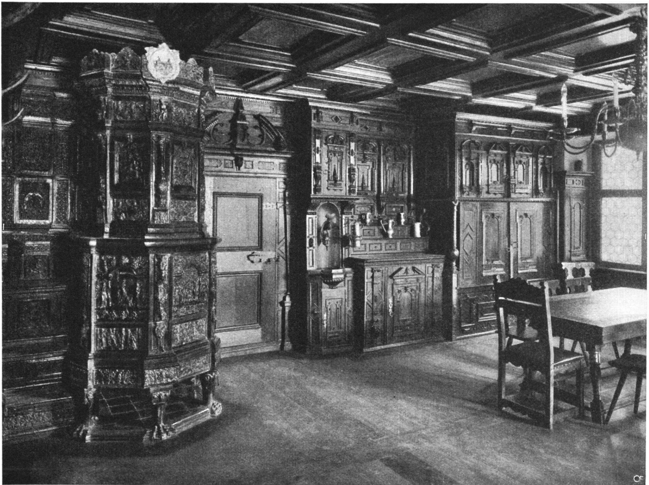
Prunkstube im Schloß Wülflingen