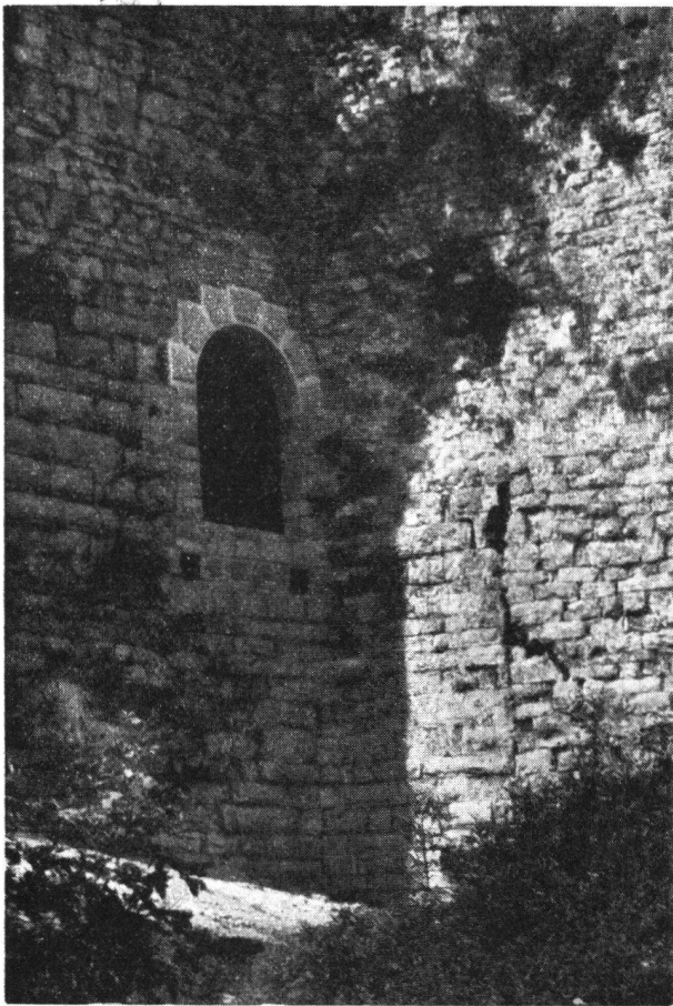
Vorderer Wartenberg, der wiederhergestellte ursprüngliche Eingang zum Bergfried