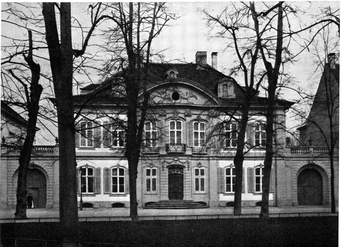
Das sog. Wild'sche Haus am Petersplatz, eines der schönsten alt-Baslerischen Herrschaftshäuser, das wir besichtigen werden