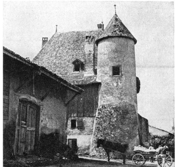
Alte Burg in Vézenaz .

Die Teilnehmerhefte mit dem detaillierten Programm, der Teilnehmerliste und dem Gepäckzettel werden den Angemeldeten frühzeitig genug zugestellt und der Betrag bei denjenigen genügend erhoben, die nicht vorziehen, ihn mit der Anmeldung auf Postcheckkonto VIII 14 239 einzuzahlen. Wir machen noch besonders darauf aufmerksam, daß das Tragen des Vereinsabzeichens obligatorisch ist. Wer noch kein Abzeichen besitzt, kann ein solches