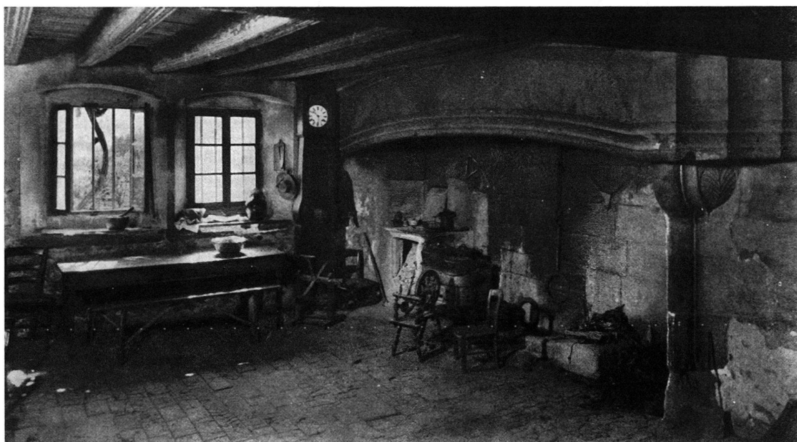
Die ehemalige Küche im Schloß Arare. Wie dieser Raum jetzt aussieht, werden die Burgenfahrer beim Empfang durch den jetzigen Besitzer sehen.