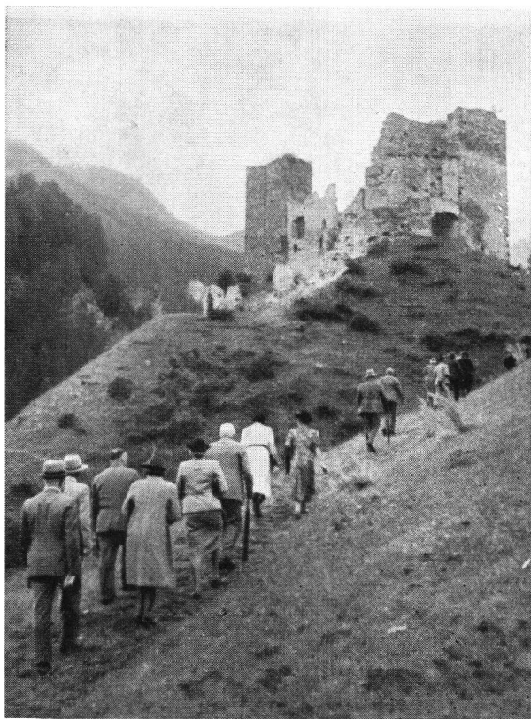
Aufstieg zur Burgruine Tschanüff

men mit der Übergabe im Beisein der Burgenvereins-Mitglieder hätte stattfinden sollen, vollzog sich bekanntlich vor wenigen Wochen.