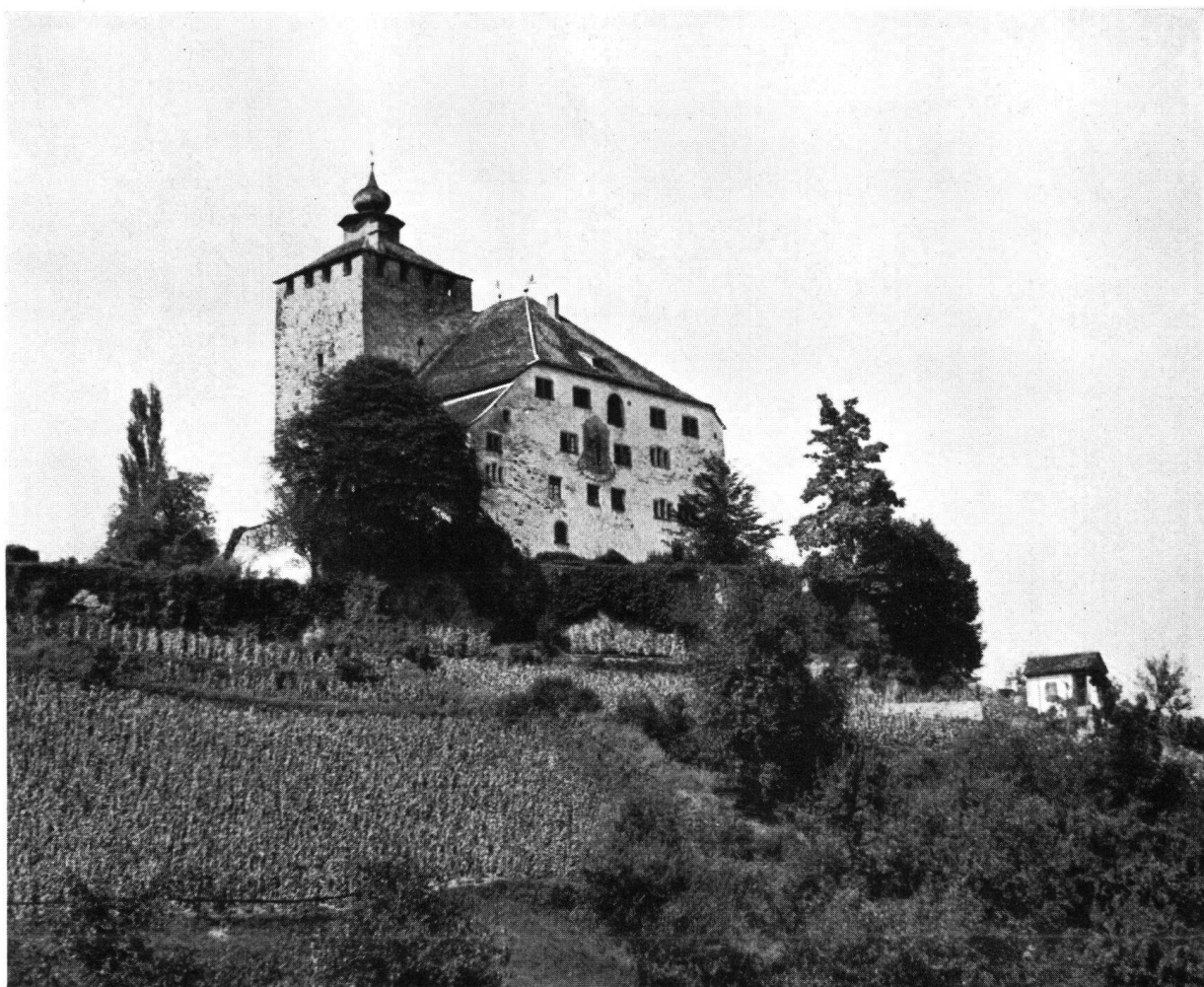
Schloß Werdenberg im st. gall. Rheintal, das besucht wird

16.10 Uhr: Mammertshofen an. Besichtigung der Burg. Imbiß.