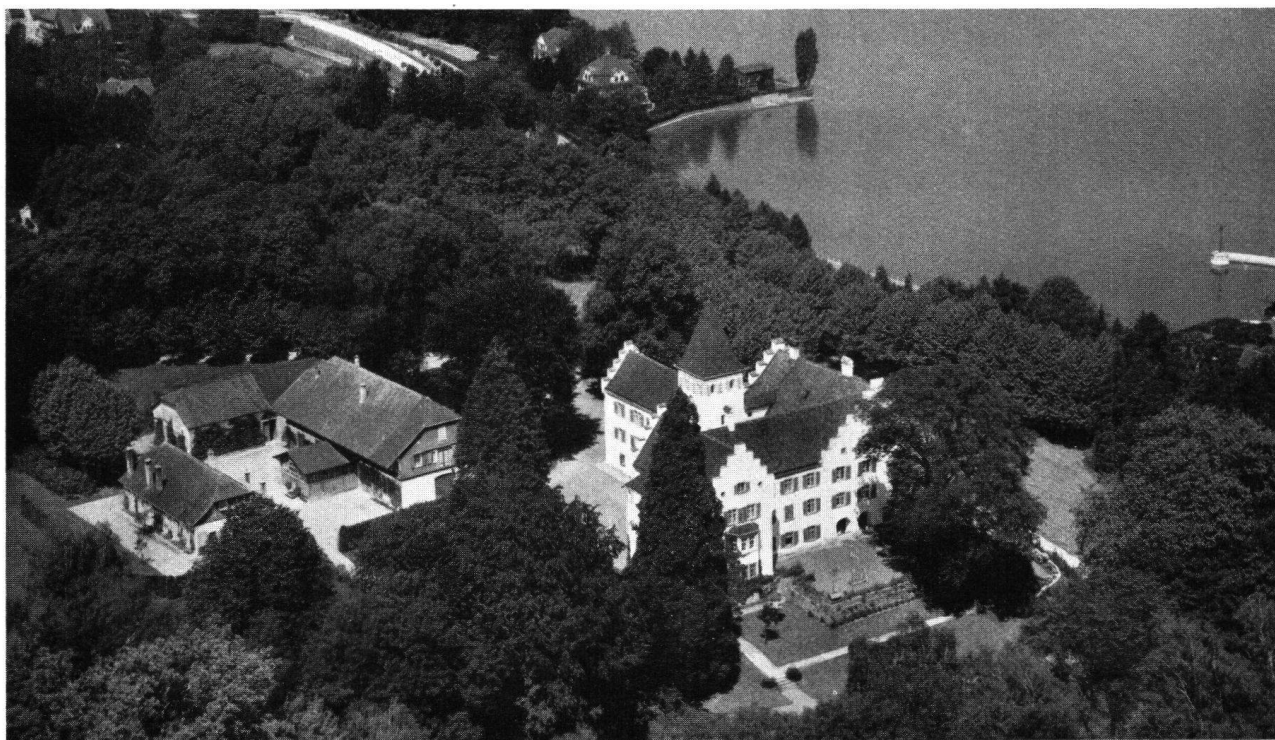
Schloß Wartegg ob Rorschach