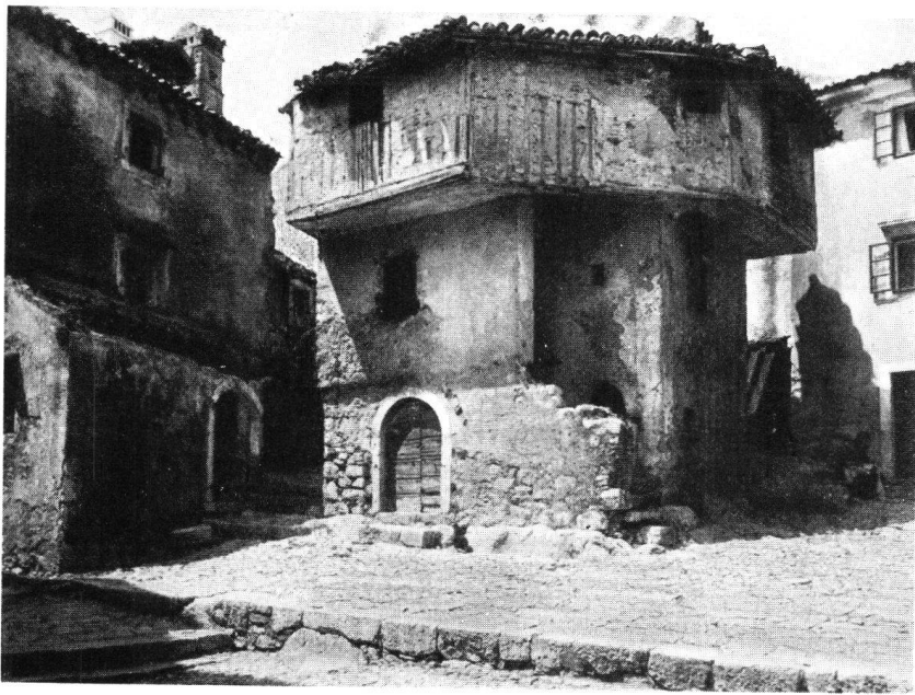
Alte Türkenwohnung bei Kotor

20. März mitzuteilen. Nach diesem Termin können Anmeldungen nicht mehr entgegengenommen werden.