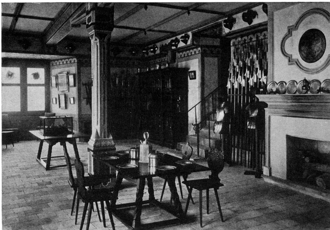
Die Kyburg. Der Festsaal im Wohnhause

halten. Für Teilnehmer, die die Fahrt im eigenen Wagen mitmachen, reduziert sich der Preis der Karte um Fr. 10.—. Wer nicht im Hotel übernachtet – also vermutlich die meisten Stadtzürcher-Teilnehmer – zahlt auf der grünen Karte Fr. 7.65 und auf der weißen Karte Fr. 11.50 weniger.