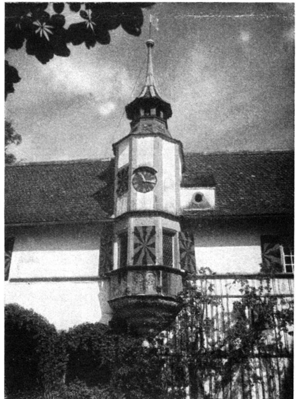
Der hübsche Erker am Schloß Burgistein mit den Wappen von Wattenwyl und Burgistein

eleganten und mit reicher Plastik geschmückten Erkerturm, 1572 von Junker von Wattenwyl-Luternau erbaut. Höchst charakteristisch sind bei Burgistein die Arkaden des einen Gebäudetraktes, voll intimen Reizes die mehr-