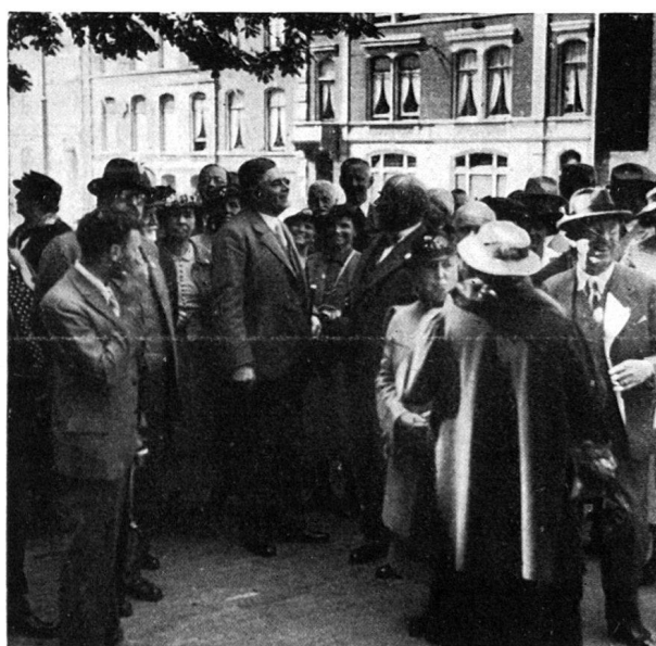
Architekt Prof. Slothouwer erzählt auf dem Domplatz in Utrecht von der Restaurierung des Domes

essanten Einblick in die vorbildlichen modernen privaten und öffentlichen Architekturschöpfungen des Landes. — Haarlem , eine der interessantesten Städte Hollands, mit schönen alten Architekturen, bot Gelegenheit zur Besichtigung der bedeutenden Gemäldegalerie im Franz-Hals-Museum und zum Anhören eines der berühmten Orgelkonzerte. Eine nette Abwechslung im Autocarreisen war die längere Motorbootfahrt in den Binnenseen von Warmond. Dann brachte uns ein Extrazug über Leiden, Rotterdam, Dordrecht hinunter durch Brabant an die Südküste der Insel Walcheren, in das an der Mündung der Schelde gelegene Seebad Vlissingen. — Eine genußvolle Rundfahrt durch die malerische Provinz Zeeland bot der folgende Tag. Wiederum ein herrliches Reisen auf den schattigen Wegen, durch all die vielen alten Fischer- und Bauerndörfchen,