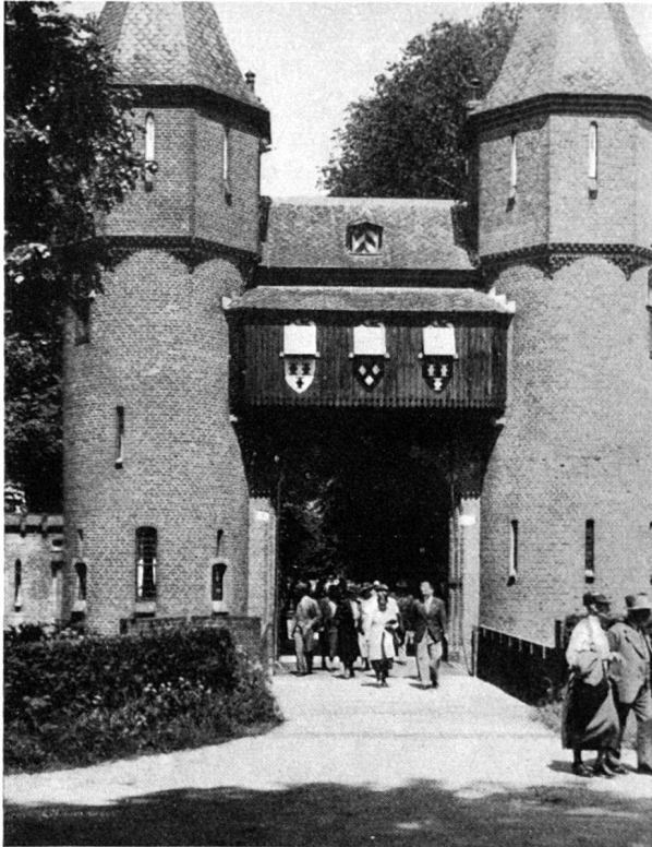
Einzug in Haarzuilen, der großartigen Burganlage des Barons de Haar.

dische Burgen und Schlösser des sympathischen wissenschaftlichen Führers Jhr. Dr. van Nispen tot Sevenaer vom Niederländischen Denkmalpflegeamt vermittelte hier eine willkommene Einführung in die Besichtigungen der nächsten Tage. — Durch eine stete Vielseitigkeit landschaftlicher Schönheiten gings