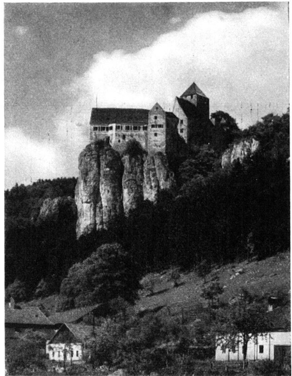
Die Burg Prunn im Altmühltal, welche auf der Fahrt besucht wird

befindliche Altar-Antependium aus vergolde-tem Kupferblech sind wahre Prachtstücke deutscher Kunst aus frühmittelalterlicher Zeit.