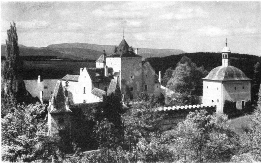
Steyersberg, die Burg der gräfl. Familie Wurmbrand-Stuppach

begrüßt die Schweizer Freunde jedenfalls mit großer Freude und Herzlichkeit und hofft, ihnen im Verlauf der Fahrt einiges zeigen zu können, das für sie den Reiz der Neuheit und des noch nie Gesehenen hat, und er hofft, daß die Reise den Schweizer Burgenfreunden nicht nur eine Reihe sehenswerter und interessanter Burgen zeigen, sondern auch darüber hinaus einen unverfälschten Eindruck von Land und Leuten, von Österreich, wie es leibt und lebt, vermitteln wird.