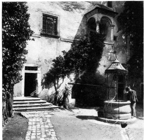
Innerer Hof der Burg Seebenstein

Teilnehmer, zwar verwöhnt durch die Schönheiten und den Komfort des eigenen Landes, auf dieser Fahrt durch das zum Teil unbekannte Österreich, dennoch alles das an geistigen und leiblichen Genüssen finden werden, das einer Reise dauernden und unvergeßlichen Wert verleiht. Der österreichische Nachbar