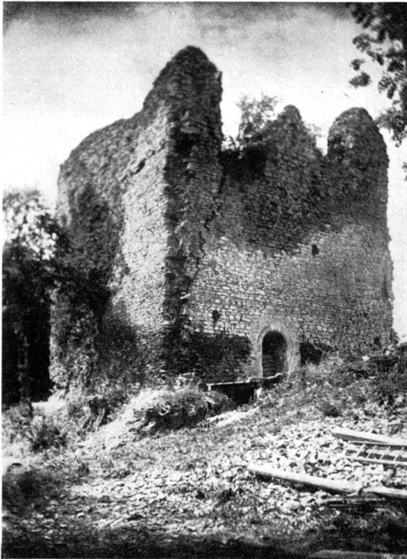
Abb. 2 vor der Restaurierung