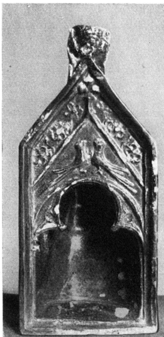
Abb. 4 Glasierte gotische Ofenkachel (Aufsatz) gefunden bei den Aus- grabungen der mittleren Ruine Wartenberg

der ehemalige hochgelegene Zugang zur Burg nach den vorhandenen Resten wiederhergestellt worden, ebenso ein hübsches romantisches Doppelfenster, von dem Teile bei den vorgenommenen Ausgrabungen gefunden wurden, die sich restlos ergänzen ließen (Abb. 6). Auch wertvolle keramische Bruchstücke und Funde von baulicher Bedeutung aus romanischer und gotischer Zeit sind durch die Ausgrabungen zutage gefördert worden. Gemäß einem Abkommen, das der Schweizerische Burgenverein mit der Schweizerischen Gesellschaft für Vogelkunde und Vogelschutz schon vor einigen Jahren abgeschlossen hat, sind auch bei der Ruine Wartenberg Nistgelegenheiten für besonders geschützte Vögel (Turmfalken, Mäusebussarde, Uhu) angelegt worden.