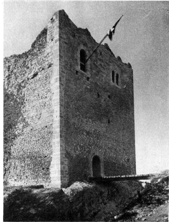
Abb. 3 nach der Restaurierung