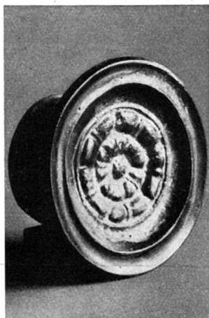
Abb. 5 Glasierte Ofenkachel gefunden bei den Ausgrabungen der mittleren Ruine Wartenberg