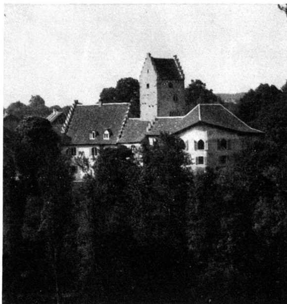
Das vor Jahresfrist z. T. abgebrannte, nun wieder hergestellte Schloß Liebenfels bei Mammern. Vgl. „Nachrichten“ Jahrgang 1933, Nr. 5 (Seite 23)

Bei der kürzlich abgehaltenen Jahresversammlung der Gesellschaft für die Erhaltung des Schlosses Chillon ist mitgeteilt worden, daß zufolge neuester Forschungen die frühere, nunmehr fallengelassene Bezeichnung gewisser Räume als „Gerichtssaal“, „Rittersaal“, „Kammer der zum Tode Verurteilten“, „Ewige Gefängnisse“ usw. der Phantasie eines Schloßwarts des 19. Jahrhunderts entstammen und keineswegs der geschichtlichen Wahrheit entsprechen.