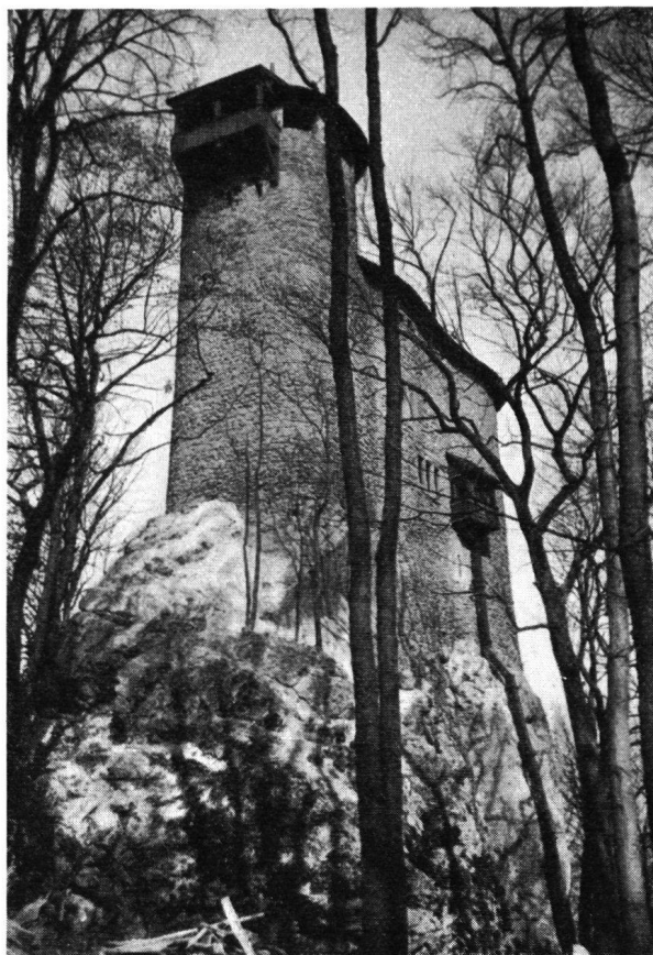
Reichenstein , wiederhergestellt, von der Bergseite (Osten)

erfreuliche Bereicherung der landschaftlichen Umgebung Basels bildet, in der nunmehrigen Gestalt. Den innern Ausbau hat der neue Burgherr nach seinem eigenem Geschmack ausgeführt.