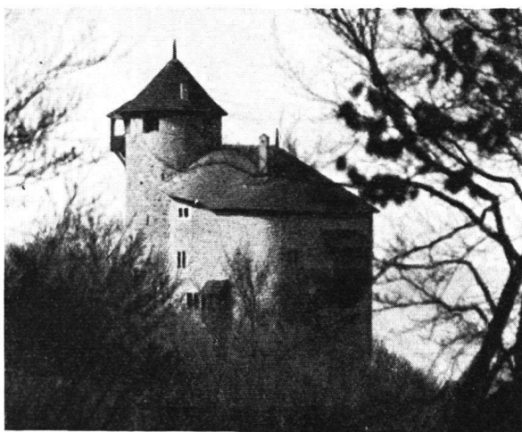
Reichenstein , wiederhergestellt, von Nordosten

In einer der letzten Nummern der „Nachrichten“ teilten wir mit, dass diese seit dem Ende des 15. Jahrhunderts nur noch als Ruine erhaltene Burg samt dem prächtigen Buchenwald von einem Basler erworben wurde, der sie nach einem Projekt des Architekten Eugen Probst und unter dessen Leitung in seiner äussern Form wiederherstellen liess. Die nebenstehenden Bilder zeigen die Burg, welche eine