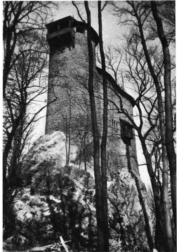
Reichenstein , wiederhergestellt, von der Bergseite (Osten)

erfreuliche Bereicherung der landschaftlichen Umgebung Basels bildet, in der nunmehrigen Gestalt. Den innern Ausbau hat der neue Burgherr nach seinem eigenem Geschmack ausgeführt.