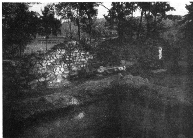
Teil der ausgegrabenen Burgruine Schönenwerd

nächste Umgebung der freigelegten Burgstelle etwas anders aus, die Limmat fließt nördlich der Burgstelle vorüber, die früheren Flussarme sind eingetrocknet, auf einem kleinen bis vor kurzem bewaldeten Hügel, der nur wenige Meter sich über das Schilf- und Kietgelände erhebt, thront das alte Gemäuer, letzter Zeuge verschwundener mittelalterlicher Zeit. Als sich die Dietikoner Burgengraber an die Arbeit machten mit Pickel und Schaufel, da war vor lauter Schutt und Gestrüpp allerdings kaum ein Stück alten Gemäuers sichtbar. Die Ausgrabungen zeigten jedoch bald, dass man es mit einer Burgruine größeren Ausmaßes als geahnt, zu tun hat. Der neueste Stand der Ausgrabungen erlaubt mit einiger Sicherheit die Anlage von Schönenwerd zu beschreiben. Deutlich lassen sich die Mauern eines 5 zu 5 Meter im Quadrat messenden Baues feststellen, dessen Mauern genau und sorgfältig bearbeitet sind. Zweifellos handelt es sich hier um den Bergfried (A) und somit um den ältesten Teil der Burg. Südöstlich davon und verbunden mit einer Mauer stand vermutlich der Palas (B) als ein 10 zu 7 Meter messendes Gebäude, abgeteilt durch eine Quermauer. Die südwestliche Mauer des Palas lief als Ringmauer in gleicher Flucht weiter und umschloss einen Hof (C). Der Zugang zu diesem Hof vermittelte ein mit Tuffsteinen eingefasstes Portal. Da diese Mauer ursprünglich zweifellos unmittelbar an das Wasser eines Limmatarmes stieß, scheint dieses Tor dem Zugangsverkehr mit Schiffen gedient zu haben.