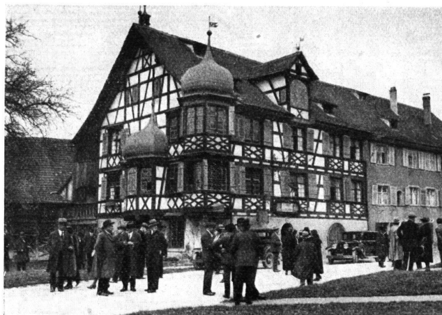
Bei der „Drachenburg“ gegenüber dem Schloss Gottlieben

P. S. Die besuchten Burgen sind ausführlich in Wort und Bild behandelt in den beiden Thurgauer Hefen der „Burgen und Schlösser der Schweiz“, die im Verlag Verhäufer & Co. in Basel unter Mitwirkung des Burgenvereins und unter Redaktion von Eugen Probst erscheinen.