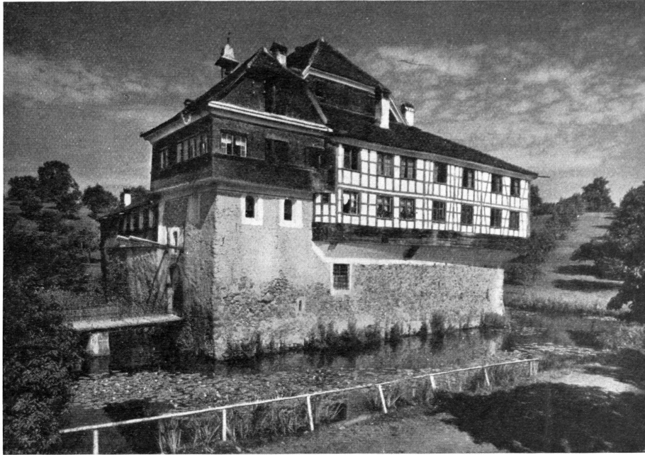
Die Wasserburg Hagenwil