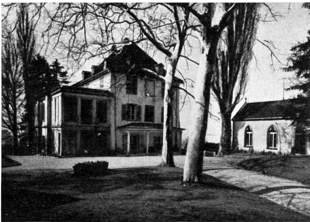
Schloß Arenenberg bei Mannenbach am Untersee, die „Visitenstube des Kt. Thurgau“