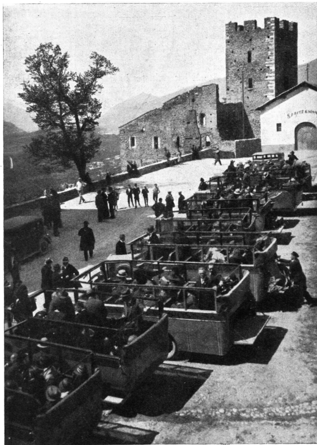
Vor der Abfahrt in Leuk. Im Hintergrund die Ruinen des ehem. bischöfl. Schlosses.