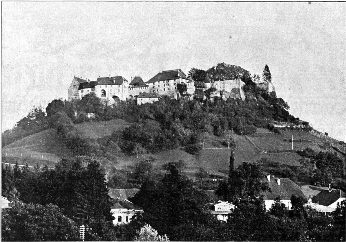
Schloss Lenzburg von Westen (Aus dem Werk von W. Merz: Die mittelalterlichen Burganlagen des Kt. Aargau)