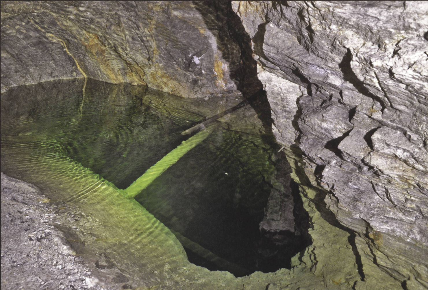
Ursera: Erste bekannte Abbauspuren, Mittelalter bis 19. Jh.