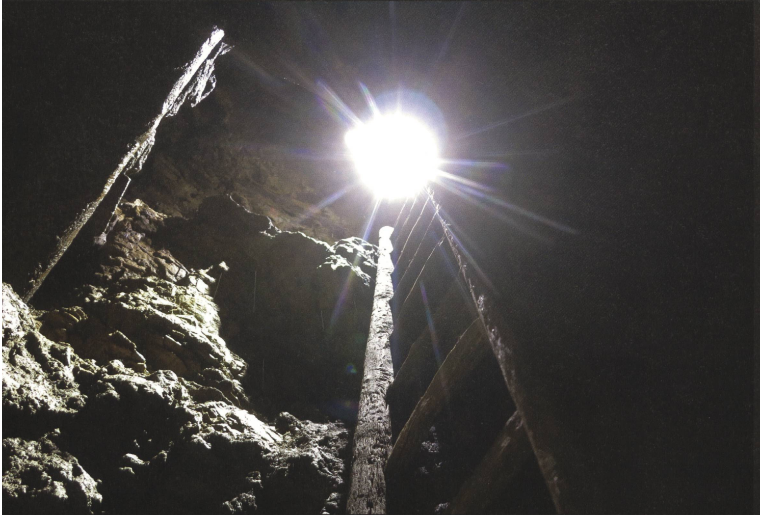
Val Tisch: Alte Holzleiter im Schacht Nr. 1