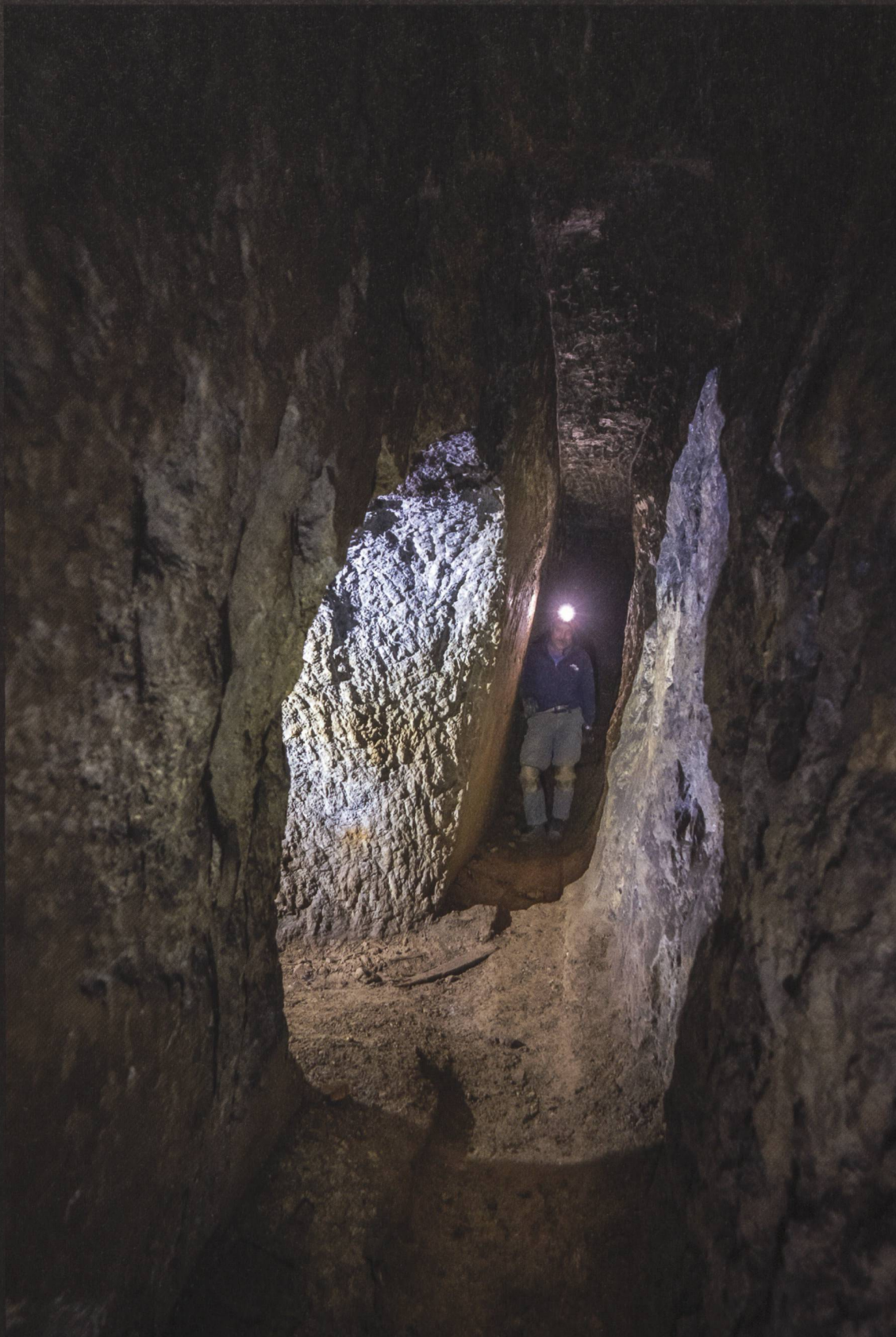
Mont Buffalora: Stollen « Sonch Michel II » mit Abdruck der alten Holzschienen