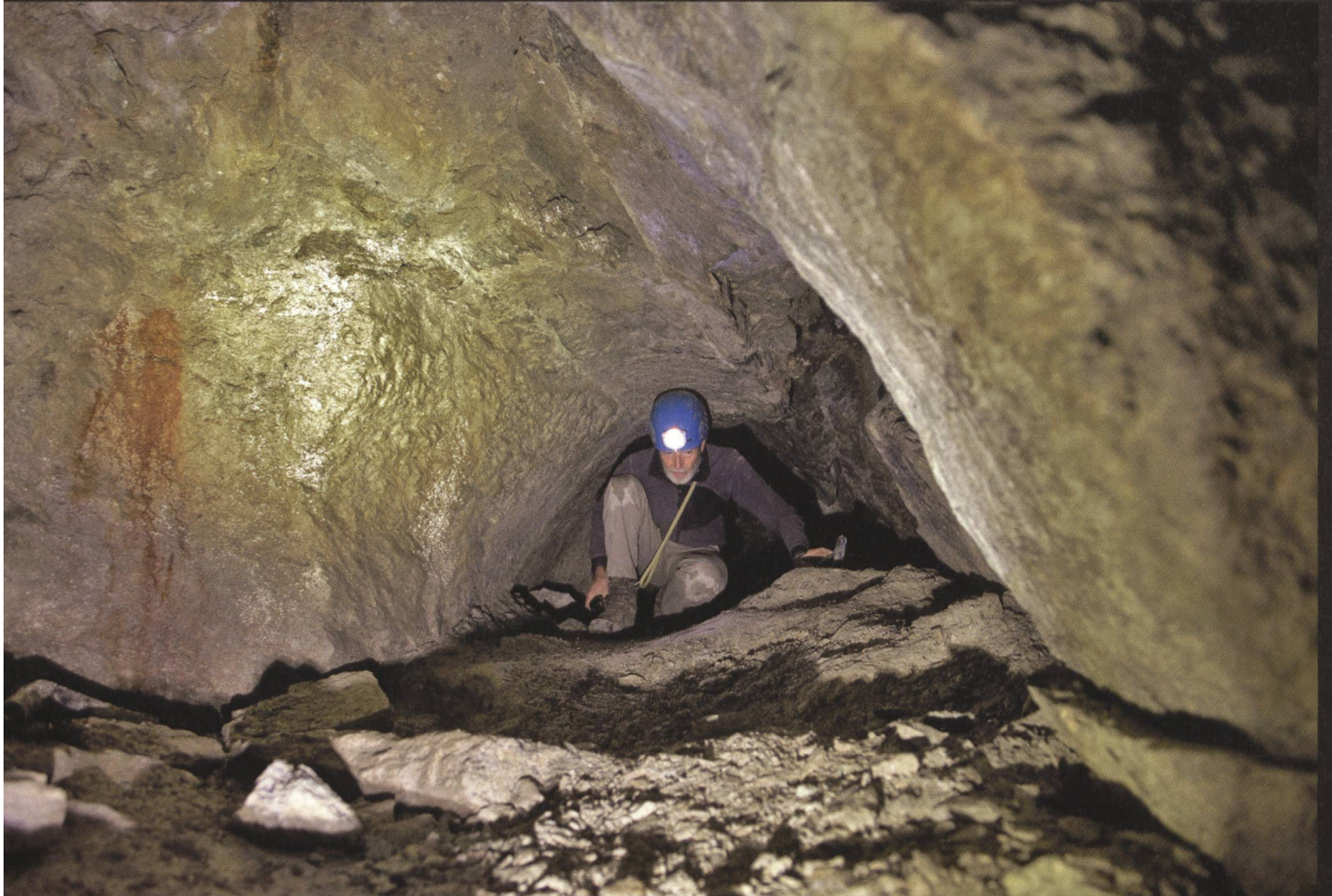
Sils-Segl Plaz: Stollen 1, Abbau sicher bis ins späte Mittelalter