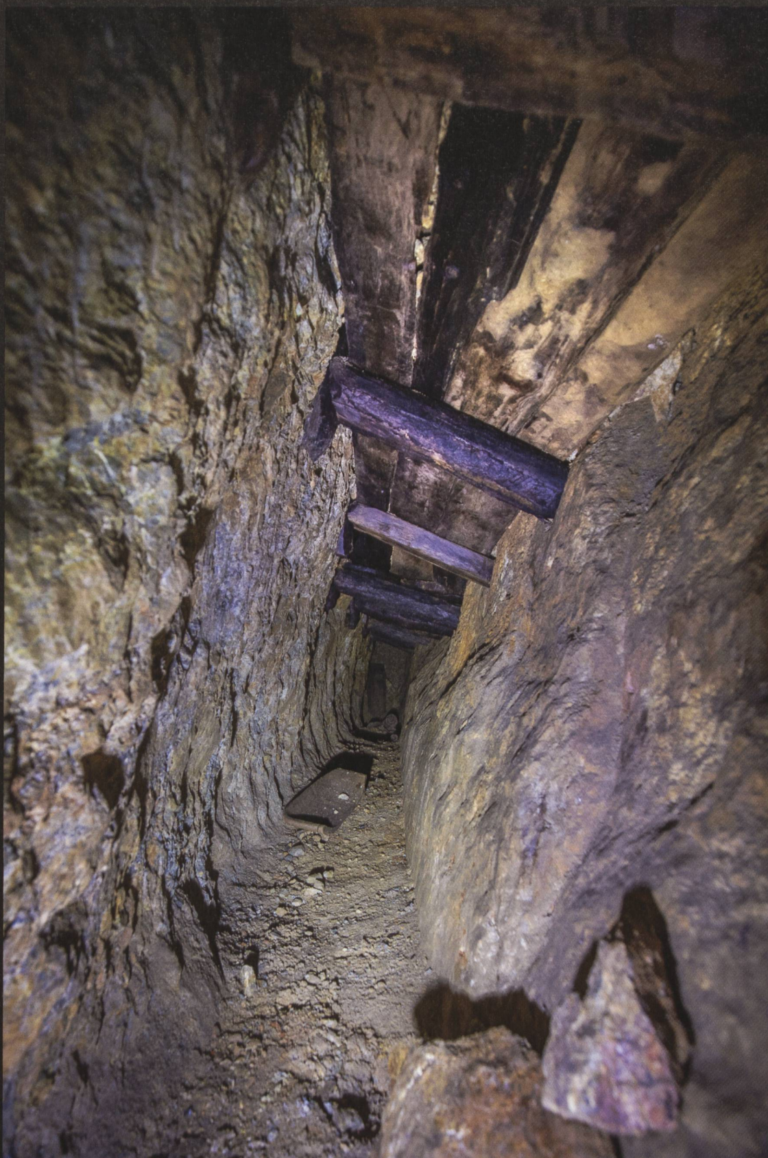
Mont Buffalora: Zwischenstrecke mit halbem Erztrog im alten Abbau