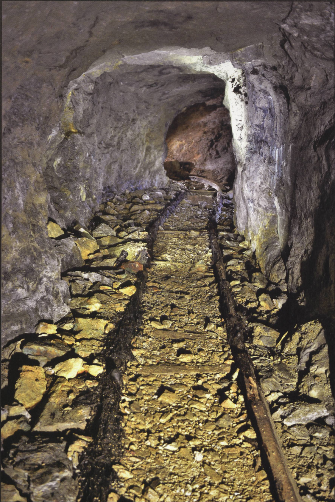
Ursera: Holzschienen aus der Zeit der Val Sassam Mines Company