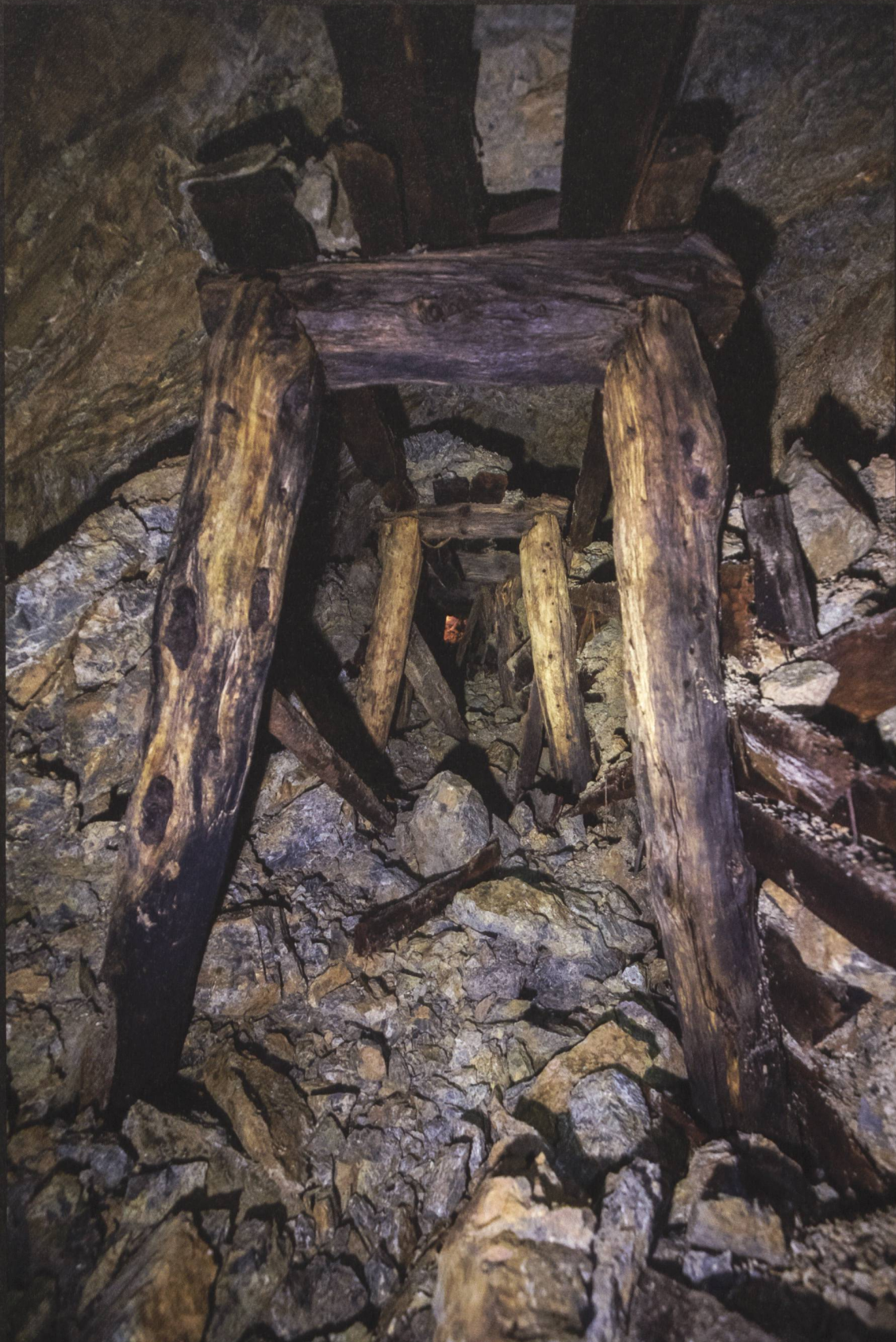
Mont Buffalora: Oberste Sohle mit teilweise gut erhaltenen Türstöcken