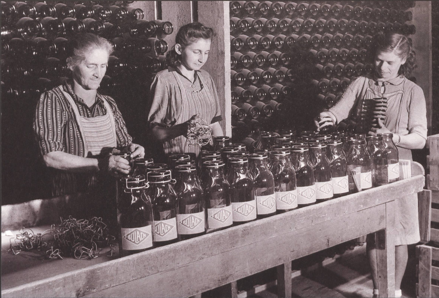
Frauen beim Bestücken der berühmten Einmachgläser