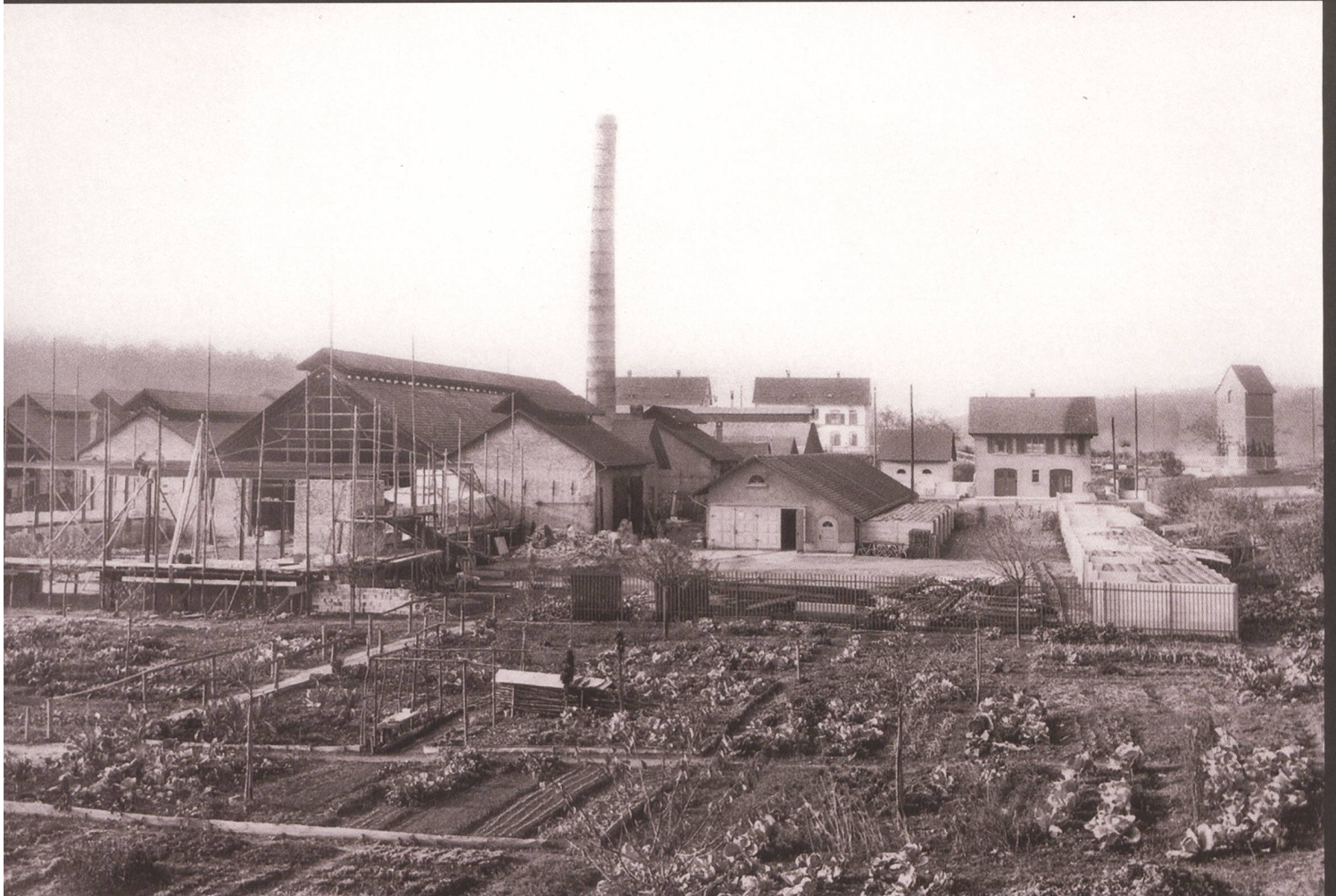
Die Glashütte Bülach während der turbulenten Zeit der 1920er Jahren