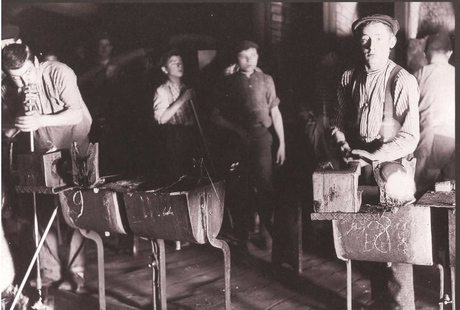
Männer bei der Arbeit