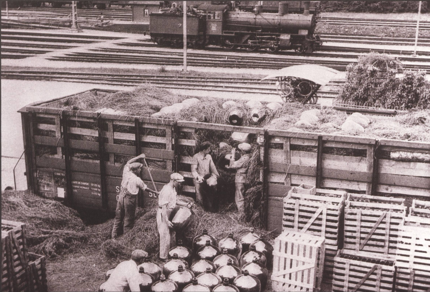
Stroh gegen Glasbruch – die bewährten 60 Liter Flaschen