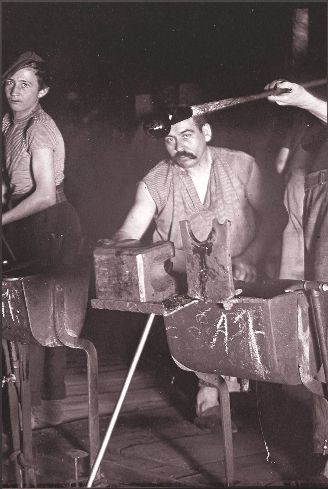
Männer bei der Arbeit