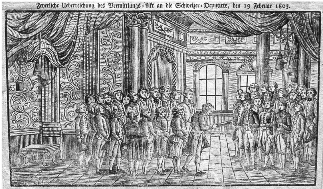
Abb. 7: Übergabe der Mediationsurkunde an die Vertreter der Schweiz. Das Dokument, das am 19. Februar 1803 unterzeichnet wurde, wies das Fricktal dem neu gegründeten Kanton Aargau zu. Zeitgenössischer Stich, Fricktaler Museum Rheinfelden.