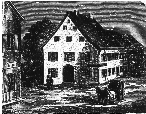
Abb. 2: Der Gasthof Adler in Frick diente den Anhängern des Ancien Régime als Vorposten bei der Organisation des Widerstandes gegen die Helvetische Republik. Lithographie, um 1872, Staatsarchiv des Kantons Aargau.