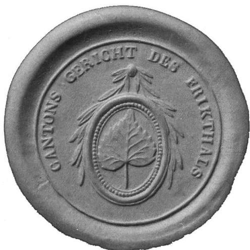
Abb. 4: Wie die anderen Amtsstellen auf Kantons- und Distriktsebene verwendete auch das fricktalische Kantonsgericht ein Siegel mit dem Lindenblattemblem.

französischen Organe berief er auf den 20. Februar 1802 eine Versammlung der Ortsvorsteher nach Rheinfelden ein. Dieser fricktalische Landtag nahm den von Sebastian Fahrländer vorgelegten Entwurf einer Kantonsverfassung mit geringen Änderungen an und wählte den früheren Waldshuter Stadtarzt zum Vorsitzenden der Verwaltungskammer.