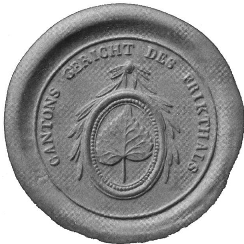
Abb. 4: Wie die anderen Amtsstellen auf Kantons- und Distriktsebene verwendete auch das fricktalische Kantonsgericht ein Siegel mit dem Lindenblattemblem.

französischen Organe berief er auf den 20. Februar 1802 eine Versammlung der Ortsvorsteher nach Rheinfelden ein. Dieser fricktalische Landtag nahm den von Sebastian Fahrländer vorgelegten Entwurf einer Kantonsverfassung mit geringen Änderungen an und wählte den früheren Waldshuter Stadtarzt zum Vorsitzenden der Verwaltungskammer.