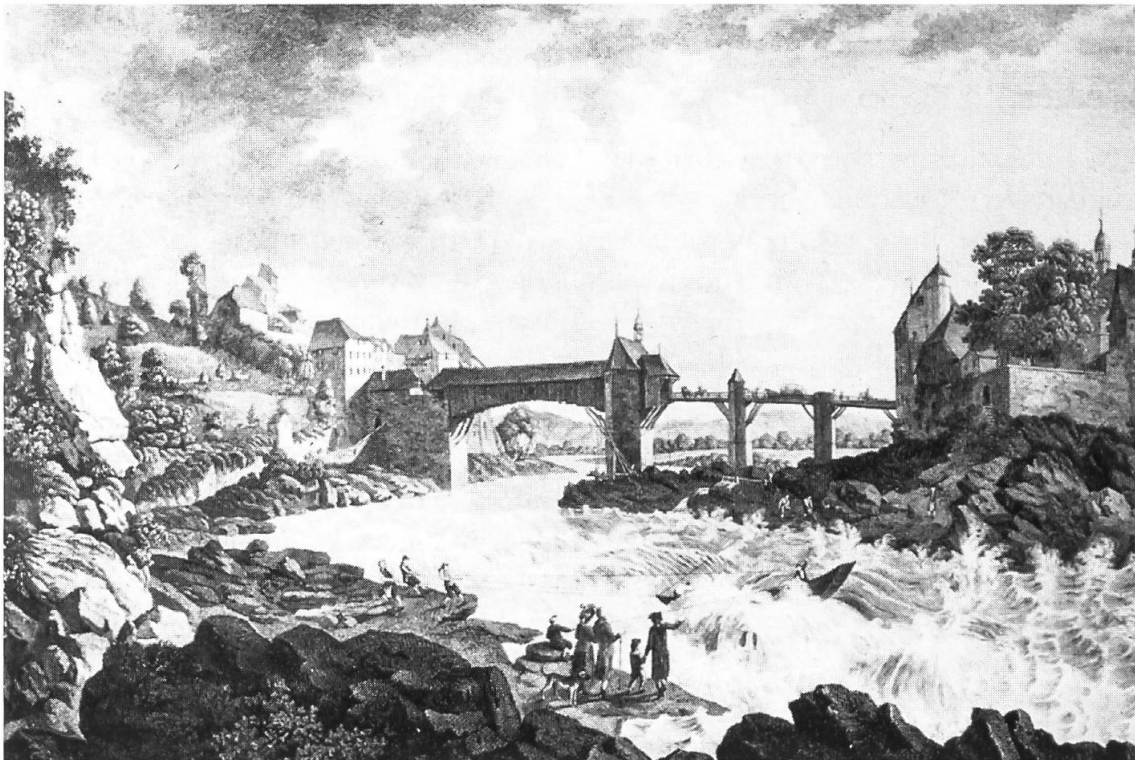
Abb. 5: Als einzige der vier vorderösterreichischen Waldstädte bestand Laufensberg aus einem links- und einem rechtsrheinischen Siedlungsteil. Die Folgen der neuen Grenzziehung zeigten sich hier deshalb mit besonderer Härte. Kolorierter Stich von Friedrich Wilhelm Gmelin, um 1785, Staatsarchiv des Kantons Aargau.

das Lindenblatt als offizielles Hoheitszeichen. Über die Gründe für diese Wahl bestehen keine schriftlichen Unterlagen. Es steht jedoch zu vermuten, dass das Symbol weder aus der Sicht der österreichischen noch der französischen oder helvetischen Entscheidungsträger mit bedeutsamen politischen Inhalten verknüpft war. Zudem entsprach die geographische Ausdehnung des Fricktals im engeren Sinne ungefähr der Ausdehnung des Homburger Vogtammtes. Das Hoheitszeichen stand bei den fricktalischen Amtsstellen bis zu deren stufenweiser Aufhebung im Laufe des Jahres 1803 in Gebrauch (Abb. 4). 22