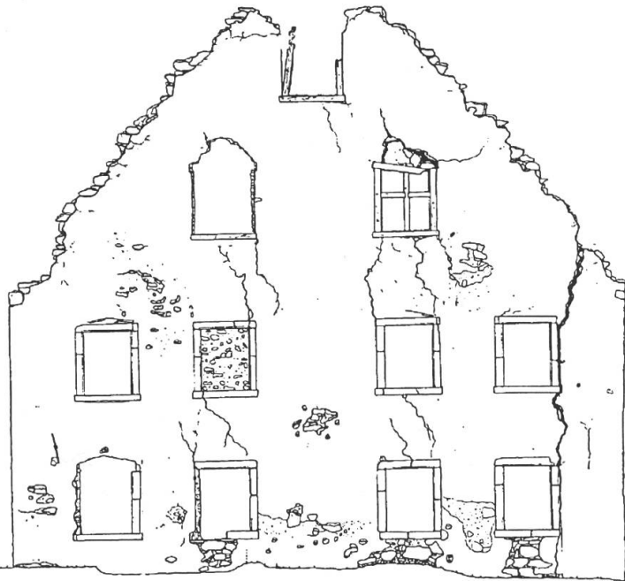
Scuol/S-charl 1989. Gebäude C, Westfas- sade innen.