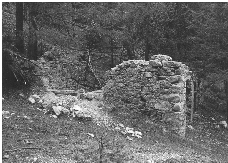
S-charl, Unter Madlain. Ruine Scheidehaus/Schmiede.

Bei Sicherungsarbeiten am vermuteten Scheidehaus in Unter Madlain wurden die Mauerkronen neu mit ein bis zwei Steinlagen ergänzt, sowie Fenster- und Türstürze stabilisiert. Die genaue Funktion des Gebäudes bei Unter Madlain ist noch unklar. Bei den Sicherungsarbeiten konnten zwei Bauphasen abgelesen werden. Wieweit diese Bauphasen aber zeitlich auseinander liegen, ist noch nicht bestimmt. Urkundliche Erwähnungen belegen bei Unter Madlain ein Scheidehaus, das im Jahre 1823 erstellt wurde. In einer späteren Notiz spricht man von einer Schmiede und Knapenunterkunft. Wieweit diese Angaben sich auf das Abbaugebiet Unter Madlain beziehen und wie lange dieser Stollen aktiv war, ist nicht bekannt. Die beiden Rekonstruktionsskizzen sollen versuchen, einen Eindruck dieser Gebäude in beiden Bauphasen zu vermitteln. Bei den Sicherungsarbeiten wurden die Mauerkronen neu mit ein bis zwei Steinlagen ergänzt sowie Fenster- und Türstürze stabilisiert.