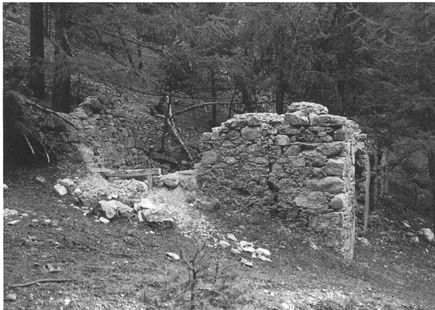
S-charl, Unter Madlain. Ruine Scheidehaus/Schmiede.

Bei Sicherungsarbeiten am vermuteten Scheidehaus in Unter Madlain wurden die Mauerkronen neu mit ein bis zwei Steinlagen ergänzt, sowie Fenster- und Türstürze stabilisiert. Die genaue Funktion des Gebäudes bei Unter Madlain ist noch unklar. Bei den Sicherungsarbeiten konnten zwei Bauphasen abgelesen werden. Wieweit diese Bauphasen aber zeitlich auseinander liegen, ist noch nicht bestimmt. Urkundliche Erwähnungen belegen bei Unter Madlain ein Scheidehaus, das im Jahre 1823 erstellt wurde. In einer späteren Notiz spricht man von einer Schmiede und Knapenunterkunft. Wieweit diese Angaben sich auf das Abbaugebiet Unter Madlain beziehen und wie lange dieser Stollen aktiv war, ist nicht bekannt. Die beiden Rekonstruktionsskizzen sollen versuchen, einen Eindruck dieser Gebäude in beiden Bauphasen zu vermitteln. Bei den Sicherungsarbeiten wurden die Mauerkronen neu mit ein bis zwei Steinlagen ergänzt sowie Fenster- und Türstürze stabilisiert.