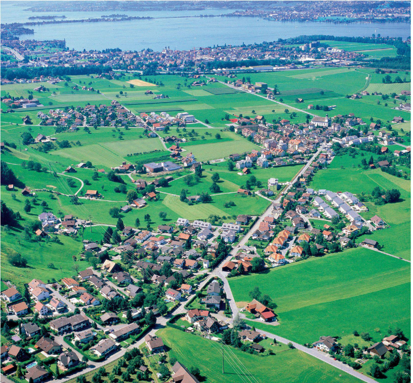
Die Siedlungsentwicklung in Galgenen, Luftaufnahme 2007.