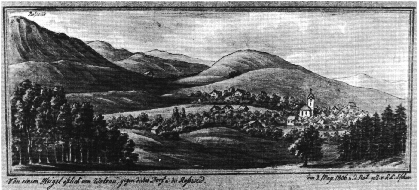
Abb. 2: Wollerau 3. Mai 1806: C. Escher «von einem Hügel östlich von Wolrau gegen dieses Dorf u. die Rossweid».

Da dieselben früh Abends um 5 spätestens bis 6 Uhr in Wollerau eintreffen möchten, so werden Euler Wohlgebornen eingeladen, vorläufig für die Besammlung des dortigen w. Bez. Raths auf besorgt zu sein, damit sodann im Schoose letzterer Behörde unverzüglich die weitem Eröffnungen gemacht werden können.» 64