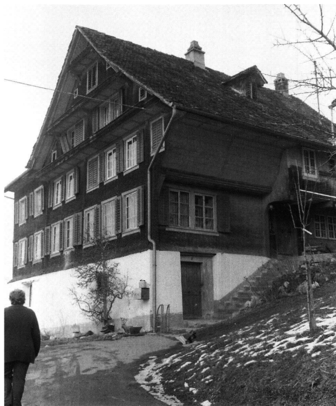
Abb. 1: Guggli.