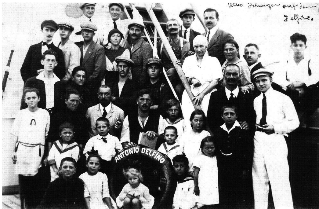
Abb. 10: Überfahrt auf dem Dampfer Antonio Delfino.

aus schreiben, morgen schon. Viele Grüsse von Joseph & Vater.» 75